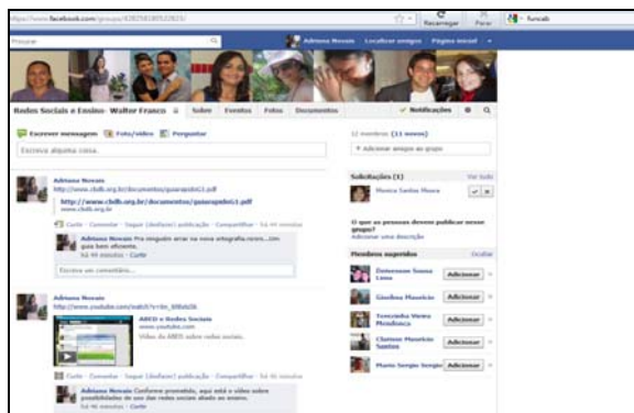
Figura 2 - Página do grupo no Facebook

a fim de servir como laboratório de pesquisa, preparando o docente para utilizar a ferramenta com seus alunos. A essa proposta, todos concordaram, mesmo os que não possuíam perfil na rede social em questão, mostrando interesse em participar da experiência, como podemos observar na figura 3: