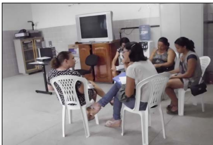
Figura 1-Discussão do grupo focal, 09/04/2012

Para preservar a identidade, cada docente será nomeado por um número, de um a seis, representando o total de participantes do grupo focal, representado na figura 1.