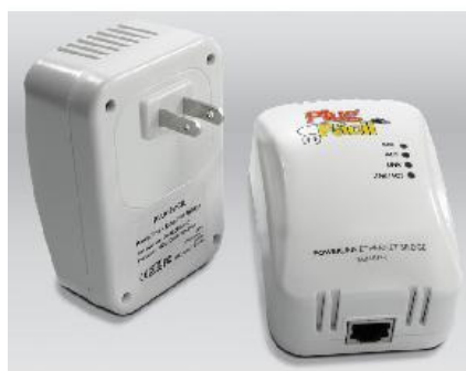
Figura 1:Modem PLC utilizado no experimento.

O gráfico acima mostra que a velocidade ficou entre 13 Mbits/s e 16 Mbits/s entre as distâncias dos adaptadores nas duas salas de aula. O teste é simples, é enviado um pacote de tamanho variado de um computador a outro e o aplicativo Iperf nos informa a taxa de transferência ou seja a velocidade do mesmo. Este resultado demonstra que a rede elétrica da escola está apta a utilizar os modems para os alunos terem acesso a internet pois a velocidade da internet na escola não ultrapassa aos 1Mbits/s. Durante os testes foram feitas 6 avaliações com o tempo de 15 minutos (cerca de 900 segundos) utilizando para isso um aplicativo denominado Iperf , gratuito e utilizado para este fim. Como em uma das avaliações do teste, os alunos do IFS em conjunto com os alunos do 3º ano e com o apoio do professor de Física iriam colocar na rede elétrica aparelhos como furadeira, micro-ondas e liquidificador como geradores de ruído que servem para saber se haveria algum impacto se eles estivessem baixando alguma atividade ao mesmo que o professor utilizou o experimento para realizar atividades em sala de aula. Mas foi comprovado que não teria problema nenhum com o uso destes aparelhos. Sendo assim o experimento com o uso da rede PLC poderia seguir a diante.