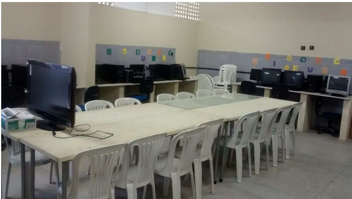
Laboratório de Informática