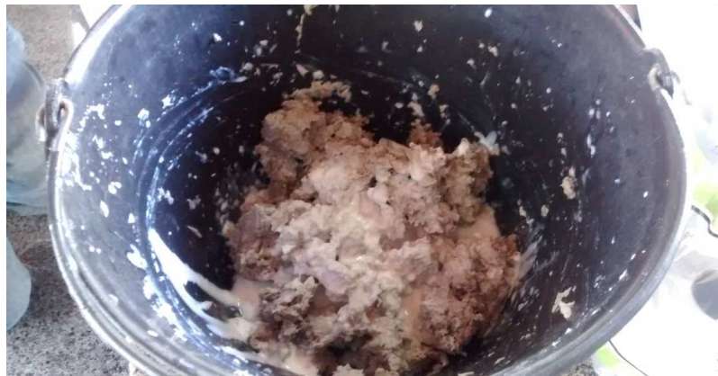
Imagem 1- (Papel higiênico com cola)