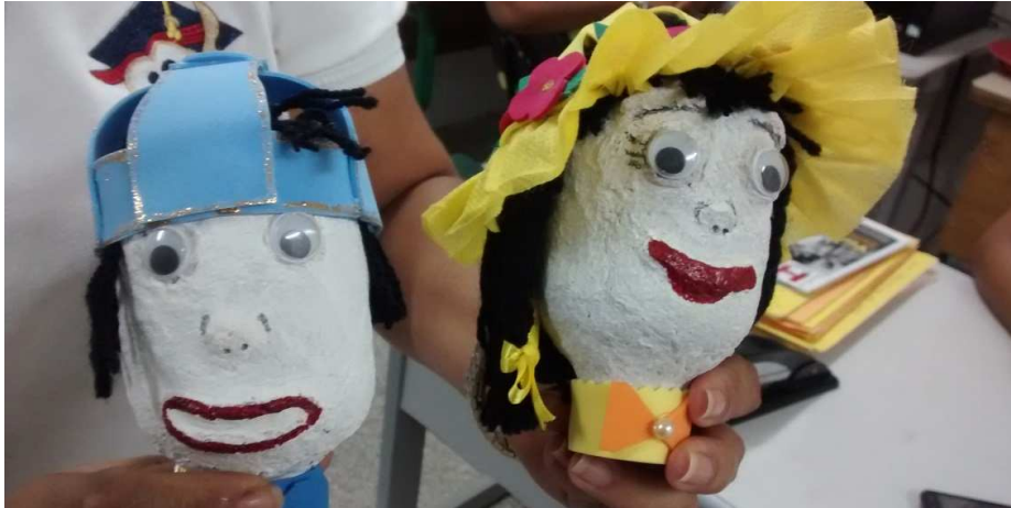
Imagem 3- (Pincel; Tinta Guache (cores sortidas); Lã; Tesoura)