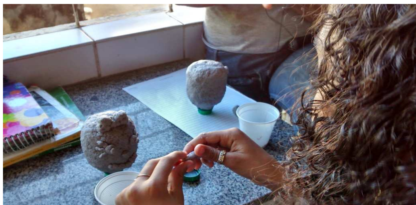
Imagem 2- (Garrafa de refrigerante e massa do machê)