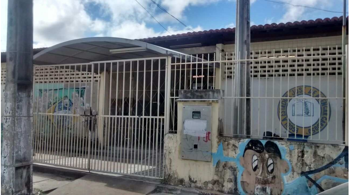
Escola Estadual José de Alencar Cardoso