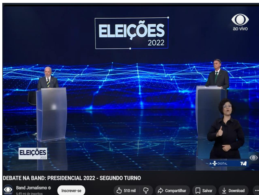
Figura 1 - Print do debate televisivo. Na imagem, os candidatos Luiz Inácio Lula da Silva e Jair Messias Bolsonaro em suas bancadas, nessa sequência

No que diz respeito ao objeto de estudo, a pesquisa faz uso de um corpus constituído por um debate político presidencial realizado no Brasil em 2022, transmitido pela rede televisiva Bandeirante e disponibilizado na plataforma YouTube. O critério de seleção do vídeo foi: a) debate entre candidatos à presidência da República; b) evento televisionado por uma emissora nacional (ex.: Globo, Band, SBT, etc.); c) disponibilidade pública na íntegra; d) debate ocorrido no segundo turno das eleições para garantir maior precisão da análise.