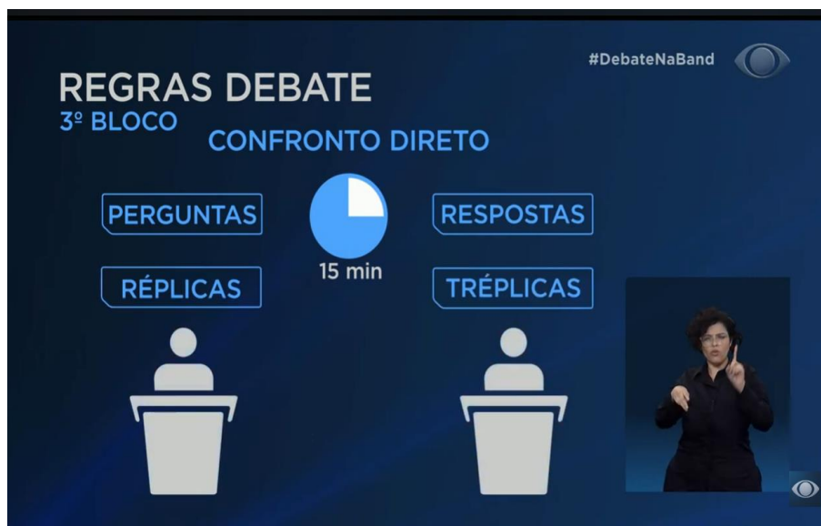
Figura 5 - Print das regras do 3º bloco