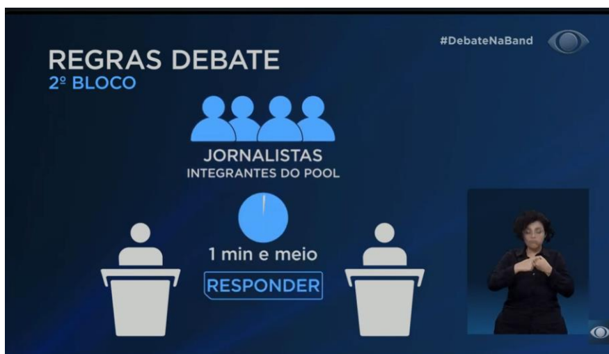
Figura 3 - Print das regras do 2º bloco