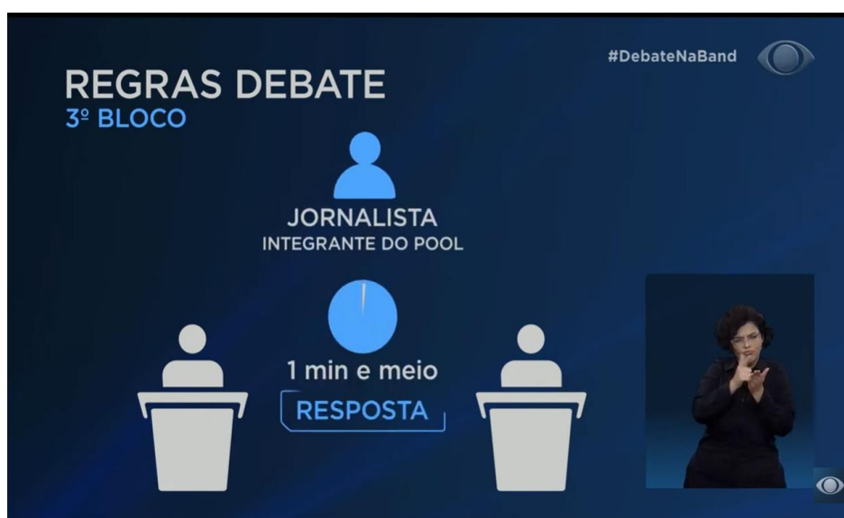
Figura 4 - Print das regras do 3º bloco