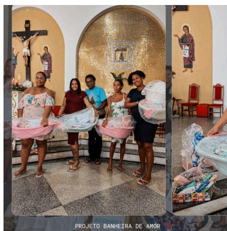
Figura 8 – Doação das banheiras do projeto banheira de amor