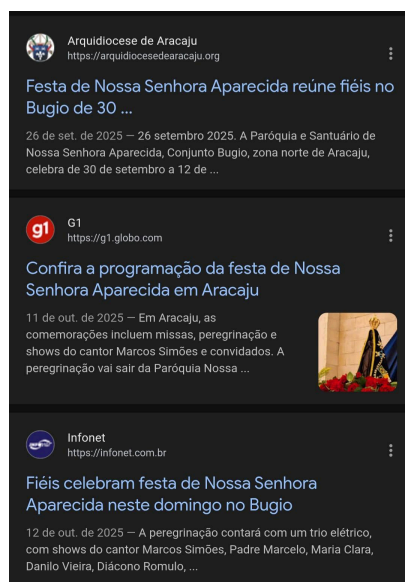
Figura 12: Recorte de resultados do Google Notícias com matérias sobre a Festa de Nossa Senhora Aparecida