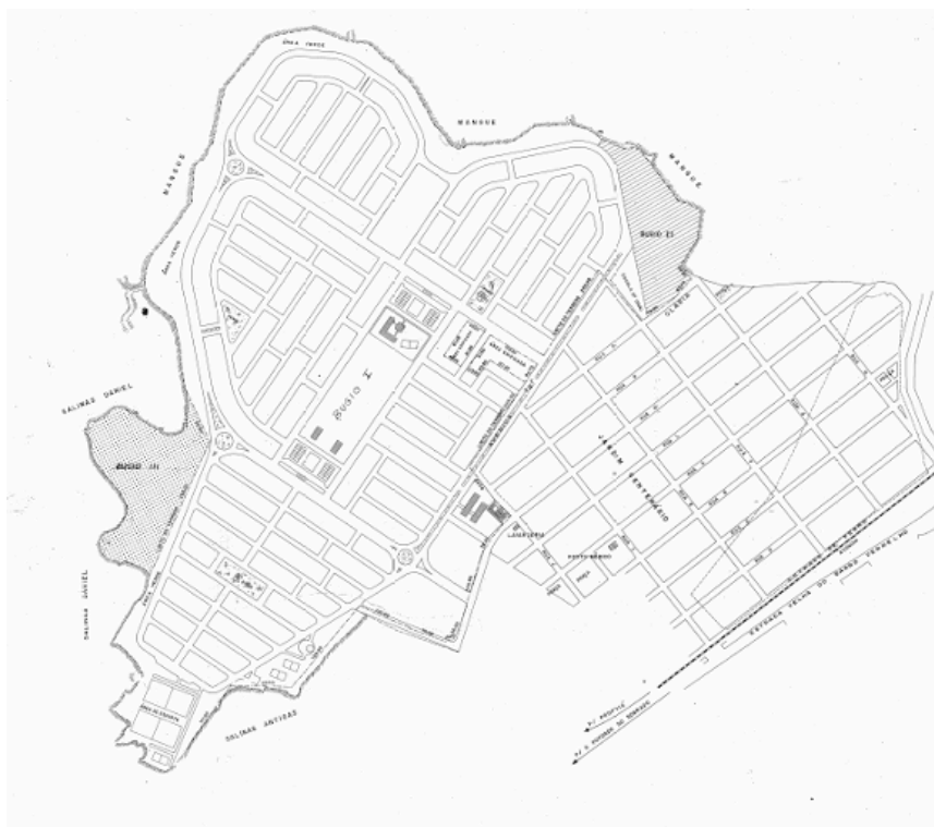
Figura 2 – Planta do projeto inicial do Conjunto Habitacional Assis Chateaubriand (Bugio).