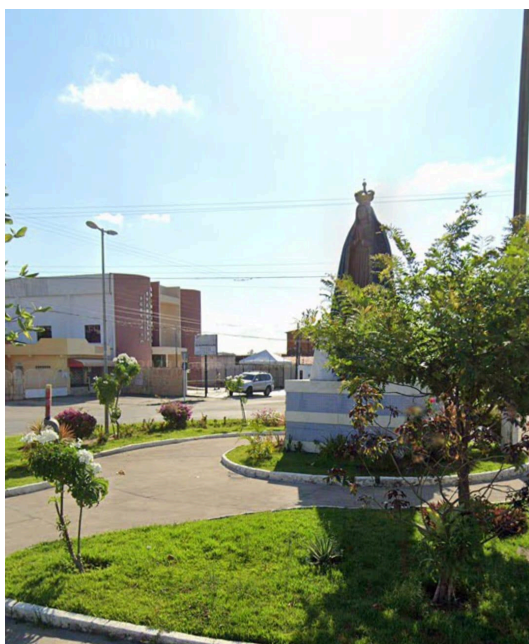
Figura 10 – Imagem de Nossa Senhora Aparecida na rotatória do bairro Bugio