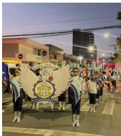
Figura 5 – Desfile de apresentação das escolas realizado por alunos do Centro de Excelência Francisco Rosa, bairro Bugio, Aracaju/SE.

As instituições escolares também exercem papel importante na dinâmica social do bairro, especialmente por meio dos desfiles realizados pelos alunos. Nesse contexto, destaca-se o Centro de Excelência Francisco Rosa, cujas atividades mobilizam estudantes, professores, familiares e moradores, promovendo a ocupação simbólica do espaço urbano e reforçando o sentimento de pertencimento local.