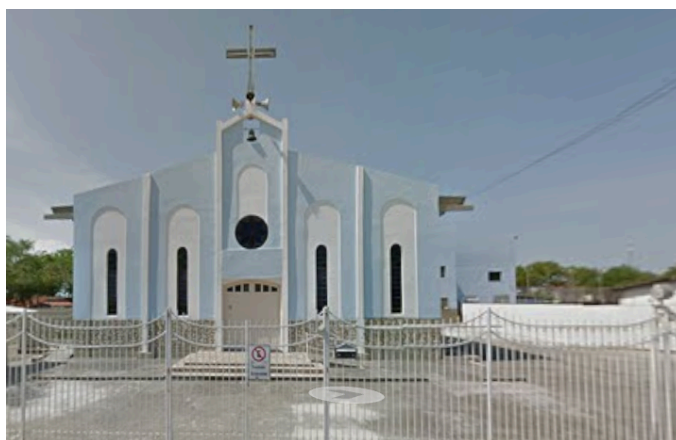
Figura 6 – Fachada do Santuário Nossa Senhora Aparecida em 2011

Fonte: GOOGLE STREET VIEW. Captura de imagem, out. 2011. Acesso em: 01/fevereiro/2026.