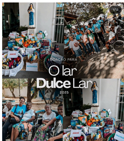
Figura 9 – Doações feitas pela pastoral Irmã Dulce