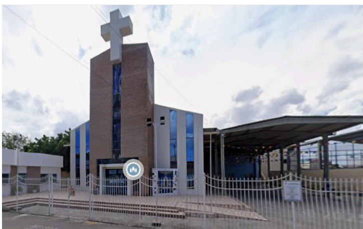
Figura 7 – Fachada do Santuário Nossa Senhora Aparecida atualmente