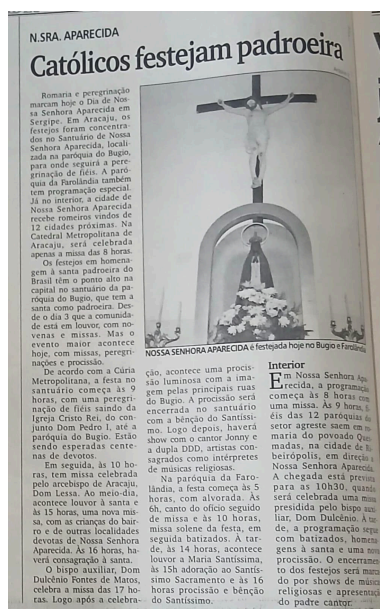
Figura 11: Divulgação da Festa de Nossa Senhora Aparecida no bairro Bugio em jornal local