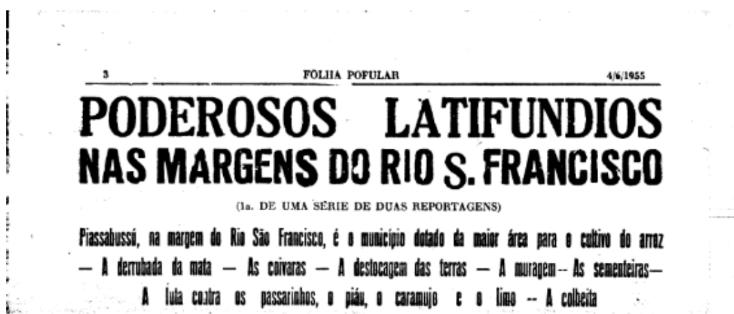
Figura 2 – Denúncia aos Latifúndios

Contudo, nosso foco com essa pesquisa não é a questão eleitoral, mas a questão agrária. Em 1954, as Ligas Camponesas estavam se organizando de forma mais concreta, mas ainda sob influência de partidos de esquerda, como o PCB e PSB, o surgimento dessas organizações ocorreu em um contexto de crise do modelo de industrialização dependente. Embora a fundação da primeira liga tenha ocorrido em 1º de janeiro de 1955, terreno político foi pavimentado anteriormente pela articulação nacional dos trabalhadores rurais.