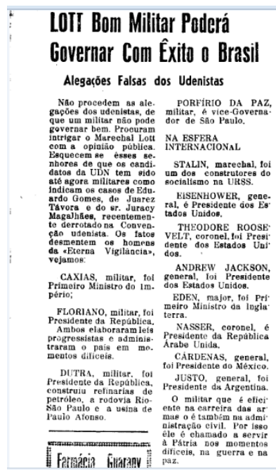
Figura 14 – Dutra é exemplo?

Fonte: Folha Popular Nº 288 (27/08/1960)