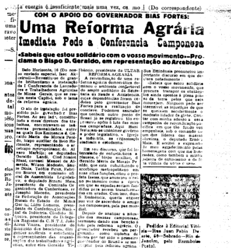
Figura 6 – 1ª Conferência dos Lavradores e Trabalhadores Agrícolas

Ainda em 1956, segundo a edição número 108 do Jornal Folha Popular (figura 7), aconteceu a instalação da 1ª Conferência dos Lavradores e Trabalhadores Agrícolas de Minas Gerais que aconteceu na capital Belo Horizonte. A conferência, contou com a presença do Governador Bias Fortes, que inclusive presidia a conferência.