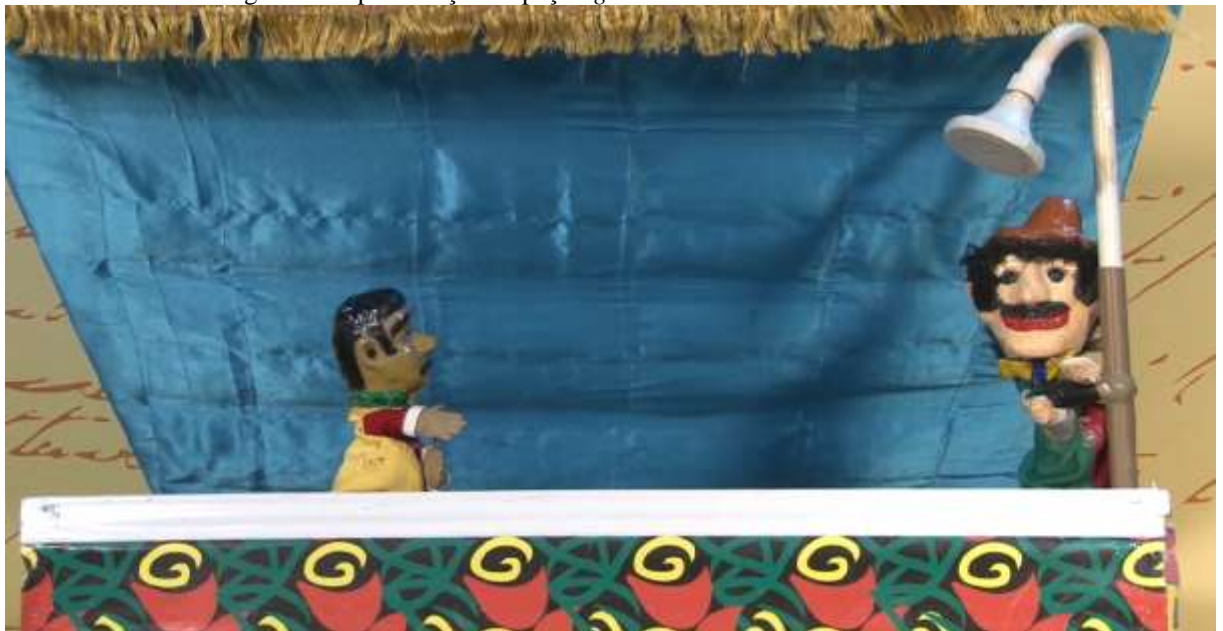
Figura 6 – Apresentação da peça Água Limitada de Haroldo Lins.

Fonte: Captura do vídeo do YouTube da apresentação Água limitada . Duração da captura 5:08 minutos disponível no canal Rede Potiguar de Televisão Educativa e Cultura Popular (2015).