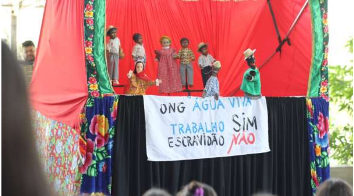
Figura 5 – Grupo Mamulengo de Cheiroso apresenta peça na Universidade Federal de Sergipe, Trabalho sim escravidão não .

Fonte: Fotografia tirada por Janaína Cavalcante, em apresentação realizada pela UFS, 2025. Disponível em: https://www.ufs.br/conteudo/75847-ufs-mpt-e-instituto-social-agatha-promovem-a-cao-contra-o-trabalho-escravo . Acesso em: 07 jan. 2026.