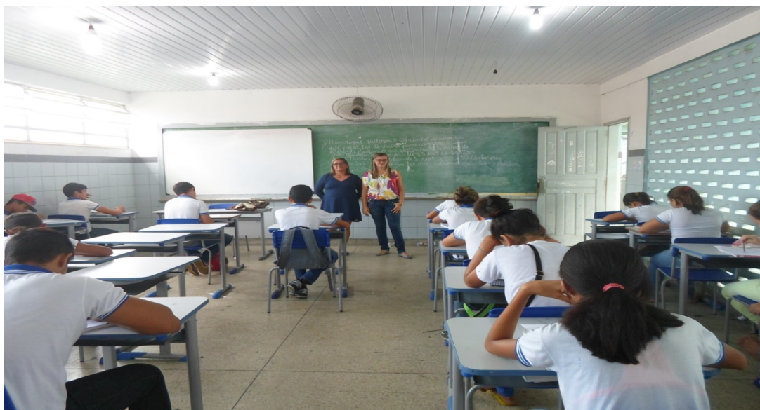
Foto 2 – Aplicação do Questionário aos Alunos