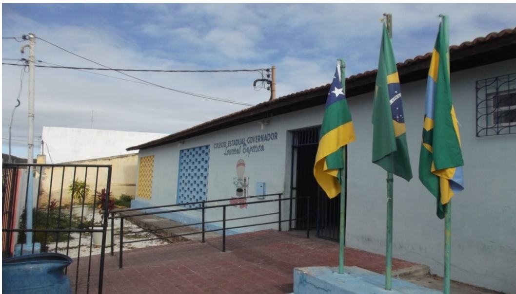
Foto 1 – Fachada Frontal do Colégio Estadual Governador Lourival Baptista