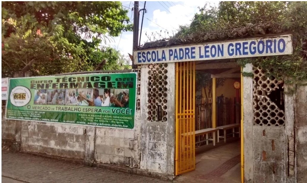
Foto 01- Fachada da Escola Padre León Gregório, 2015