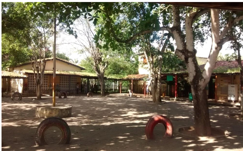
Foto 03 - Pátio da Escola Padre León Gregório