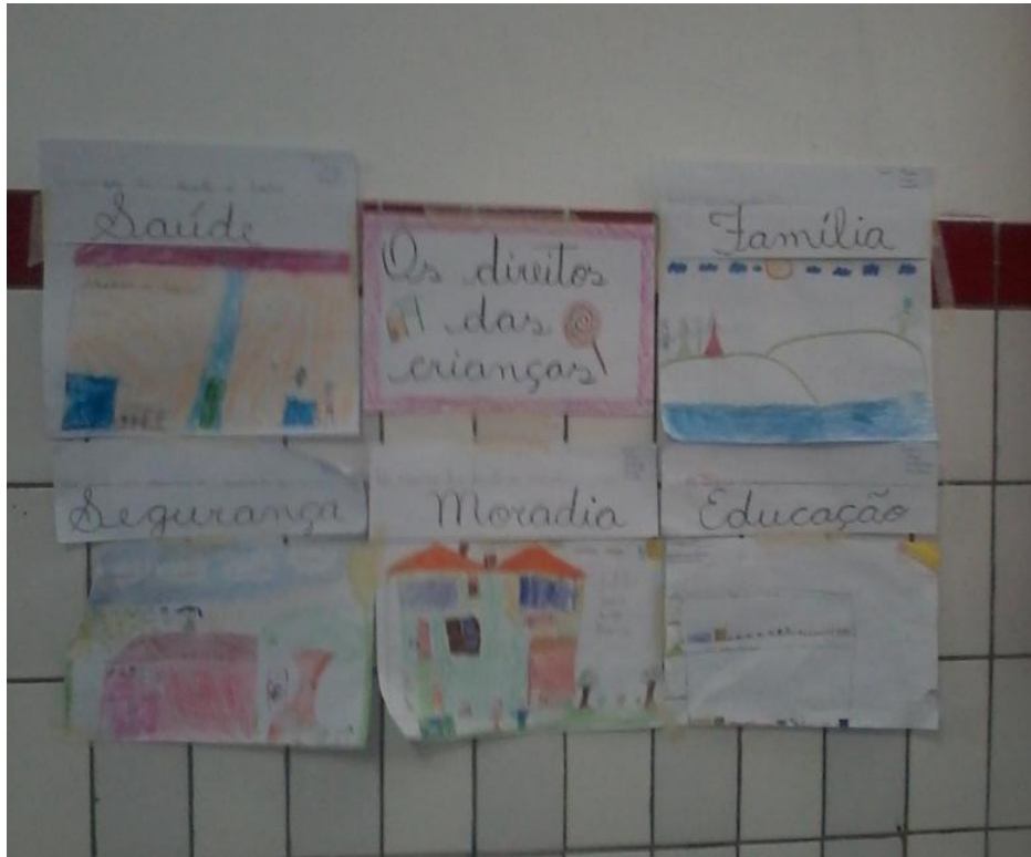
Foto 5 – Exposição de trabalhos sobre Estatuto da Criança e Adolescentes ECA.