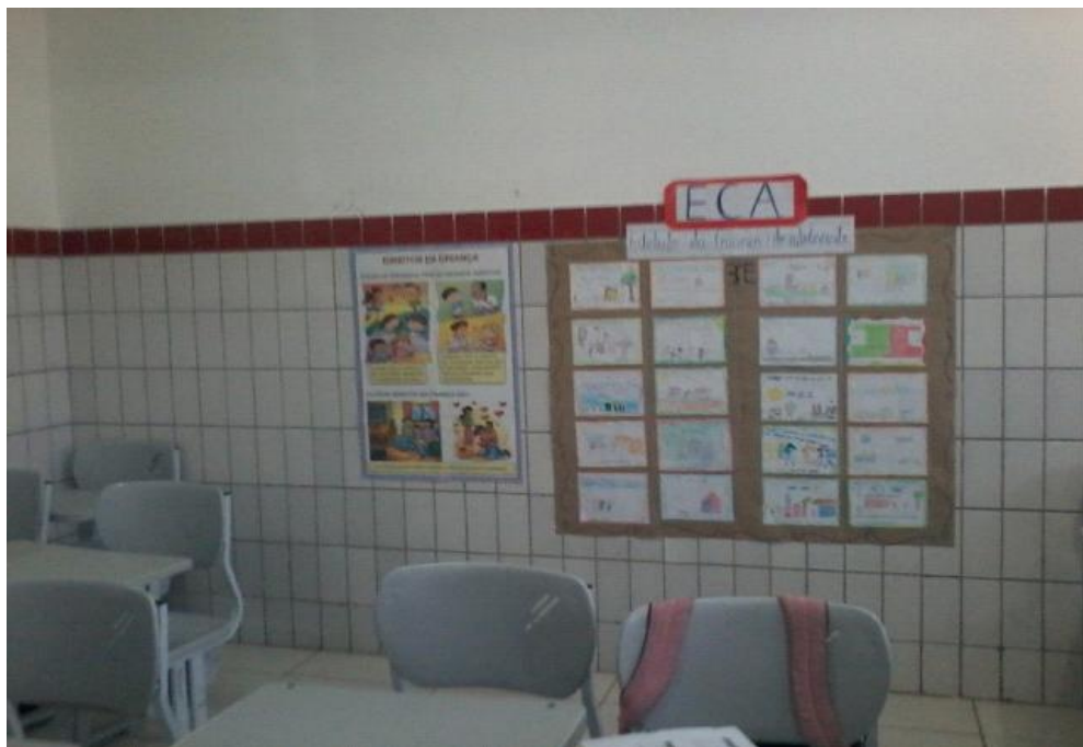
Foto 6 – Exposição de trabalhos ilustrações sobre os direitos das crianças e adolescentes.