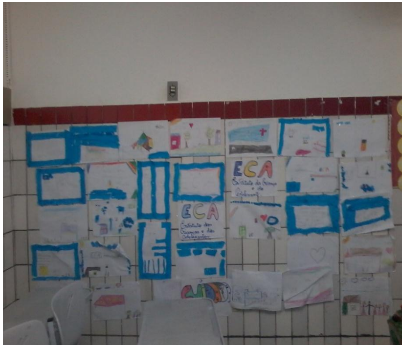
Foto 4 – Exposição de trabalhos sobre Estatuto da Criança e Adolescentes ECA.

Todos os alunos participaram das atividades com empenho e identificaram os direitos das crianças e adolescentes.