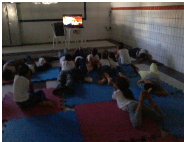
Foto 2 – Exibição do filme “ Meu Malvado Favorito”. Fonte: Resultado obtidos de atividades realizadas na turma do 3º ano “E” na Escola Municipal Ensino Fundamental Professora Núbia Marques.