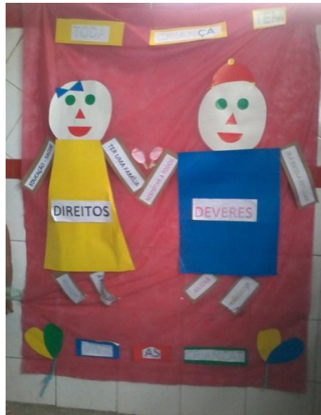
Foto 7 – Exposição de painel sobre os direitos e deveres das crianças e dos adolescentes. Fonte: Resultado obtidos de atividades realizadas em sala na turma do 3º ano “E” na Escola Municipal Ensino Fundamental Professora Núbia Marques

Os dados do gráfico abaixo é referente aos dados colhidos através de questionário durante a pesquisa na sala de 3º ano “E” Observou – se que a maioria da turma desconhece o Estatuto da Criança e Adolescente – ECA.