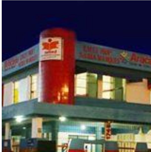
Foto 1 – Fachada Frontal da Escola Municipal de Ensino Fundamental Prof.ª Núbia Marques

Fotos da Escola Municipal de Ensino Fundamental Professora Núbia Marques e dos alunos no momento em que os alunos estão assistindo o filme e vídeos sobre o ECA.