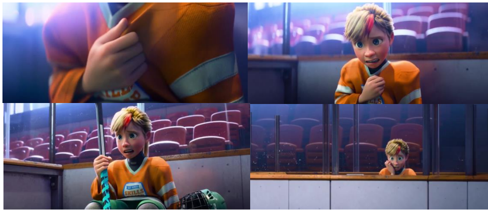
Figura 6: Crise de ansiedade da Riley

A intensificação da cor laranja reforça visualmente a pressão psicológica, enquanto, no plano externo, Riley manifesta sintomas físicos característicos da ansiedade, como agitação corporal, suor frio e aceleração dos batimentos cardíacos. Como afirma Aristóteles(2000, p. 53), “[s]eja, então, a compaixão certo pesar por um mal que se mostra destrutivo ou penoso, e atinge quem não o merece”, alternância entre o caos interno e o sofrimento visível da personagem orienta o auditório a reconhecer a gravidade da situação, favorecendo um processo de identificação e empatia pela personagem Riley.