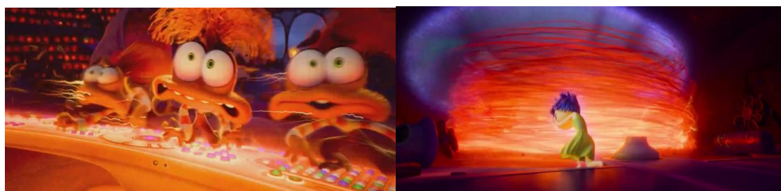
Figura 5: Descontrole da Ansiedade

O colapso da Ansiedade ocorre durante o jogo decisivo, quando a convicção de “não sou boa o bastante” se consolida como novo senso de si da personagem Riley. Sob pressão extrema, Riley ultrapassa limites éticos e emocionais, como tomar a vez de uma colega de equipe e cometer uma falta contra uma de suas melhores amigas. A penalização que a retira temporariamente do jogo funciona como um ponto de rompimento da narrativa, no qual a tentativa de controle absoluto da Ansiedade revela seus efeitos mais destrutivos. Nesse instante, o filme evidência a distância entre a promessa de proteção e o resultado real de suas ações.