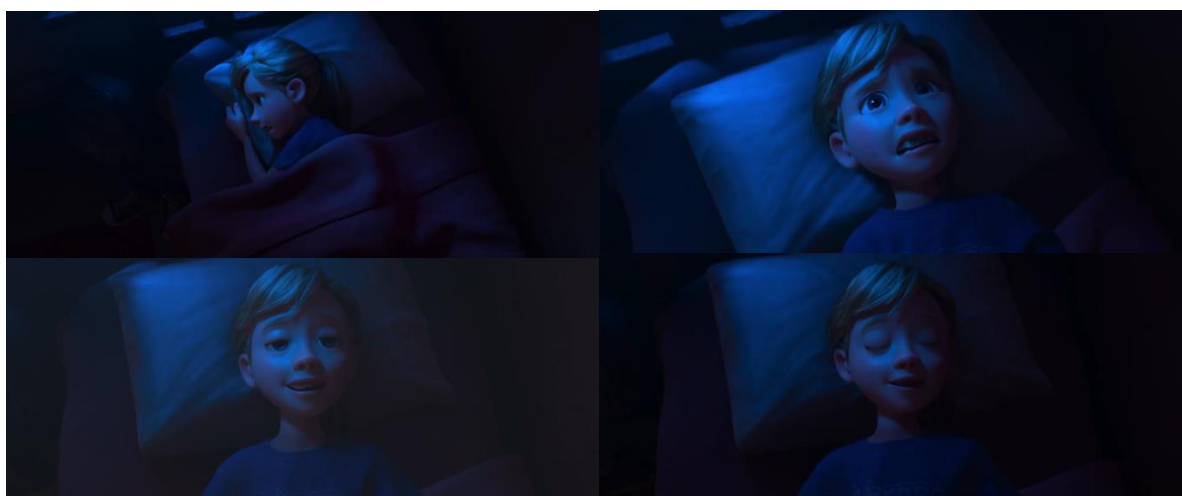
Figura 2: expressões da Riley

Ao afirmar que é necessário antecipar “cada erro”, a Ansiedade transforma o futuro em um conjunto contínuo de ameaças. Sob a perspectiva aristotélica, o medo está associado àquilo que depende do acaso e pode resultar em dano ou vergonha decorrente da representação mental de um mal futuro. Dessa forma, qualquer possibilidade futura passa a ser interpretada como risco. A estratégia discursiva da personagem intensifica a sensação de vulnerabilidade e justifica o excesso de controle, produzindo persuasão emocional ao manter Riley constantemente em estado de alerta.