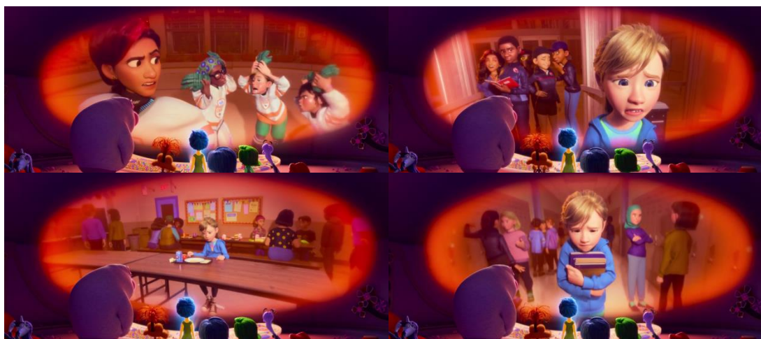
Figura 1: Projeções negativas

função é “planejar o futuro”. Na mesma sequência, a Ansiedade projeta, na central de comando, cenários negativos de futuros possíveis, relacionados aos próximos anos da vida de Riley.