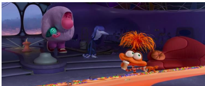
Figura 3: A ansiedade tomando café

Com a expulsão das emoções primárias da central de comando, a Ansiedade passa a dominar sem objeções. Em uma das cenas mais marcantes, Riley acorda durante a madrugada para treinar compulsivamente, sob comando da Ansiedade. A cada erro cometido, impõe a si mesma punições físicas, evidenciando o excesso de cobrança e a internalização da culpa.