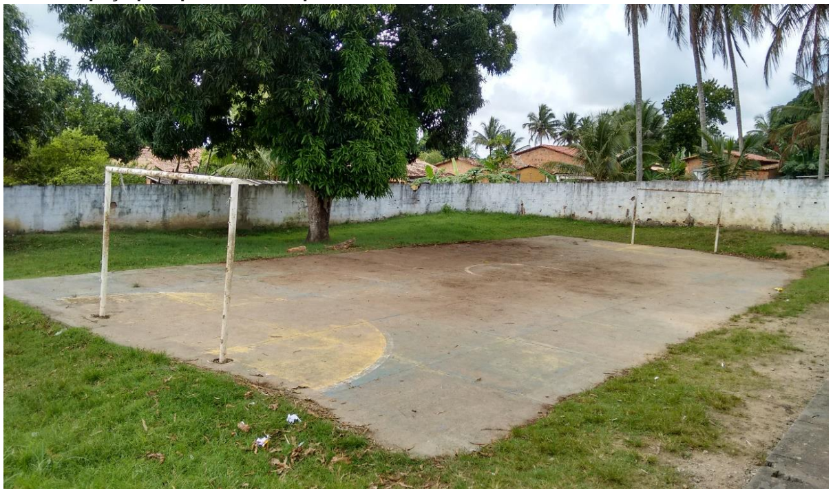
Foto 4: Espaço para práticas de esportes na E.M. Nicola Mandarino