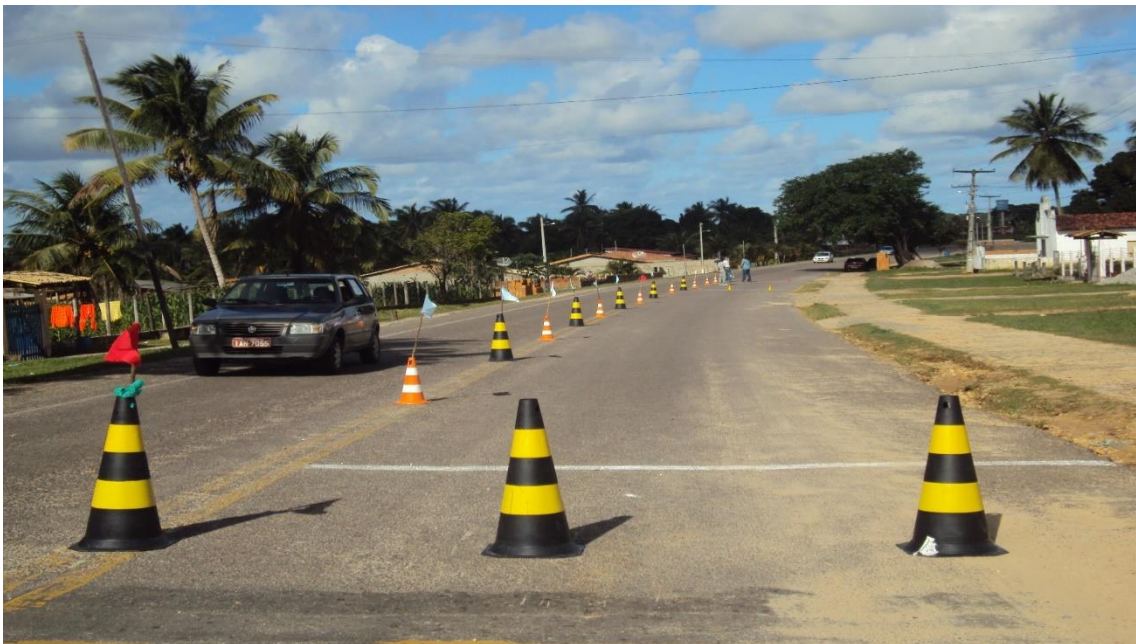
Foto 1: Rodovia Estadual Umberto Mandarin onde se localizam as escolas