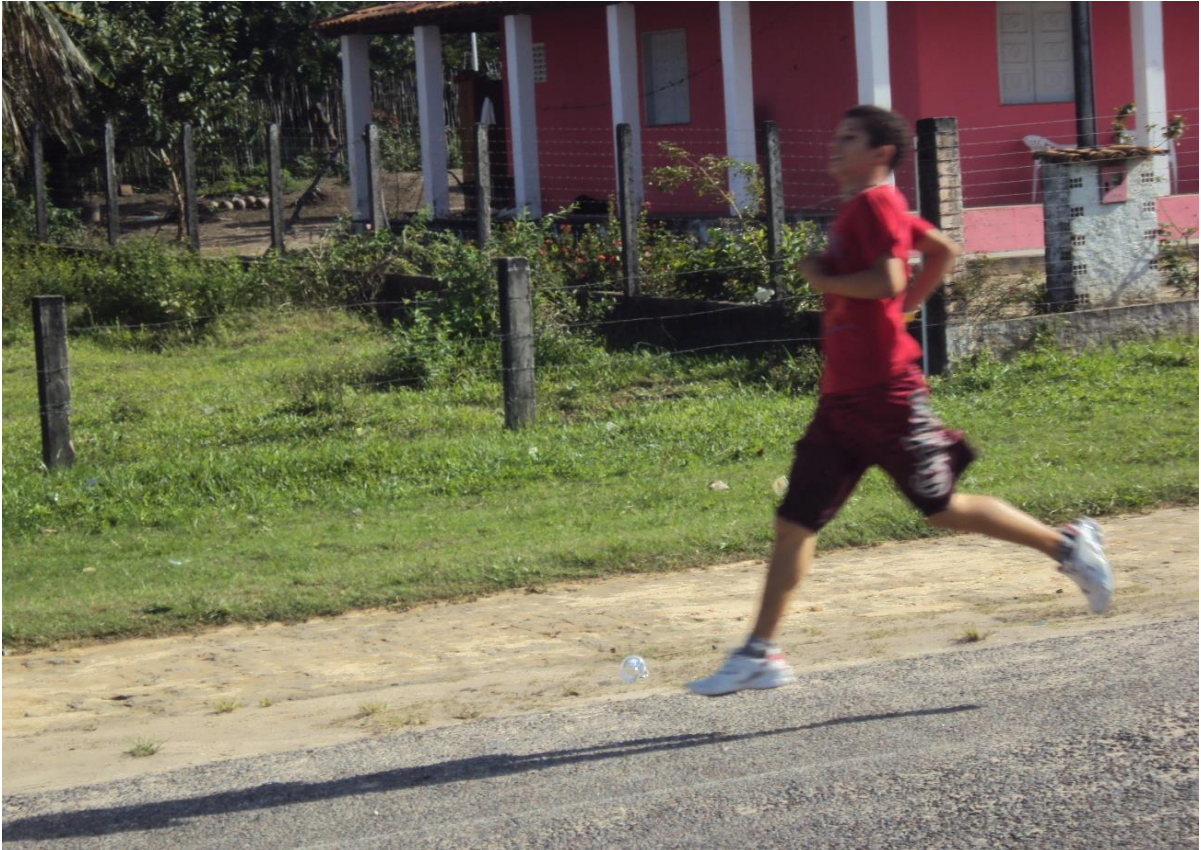
Foto 5: A rodovia como suporte para prática de atividades esportivas