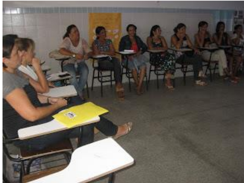
Figura 2 Fotografia da aplicação de questionário aos professores. Acervo da Escola Municipal Cecílio Eugênio Alves.