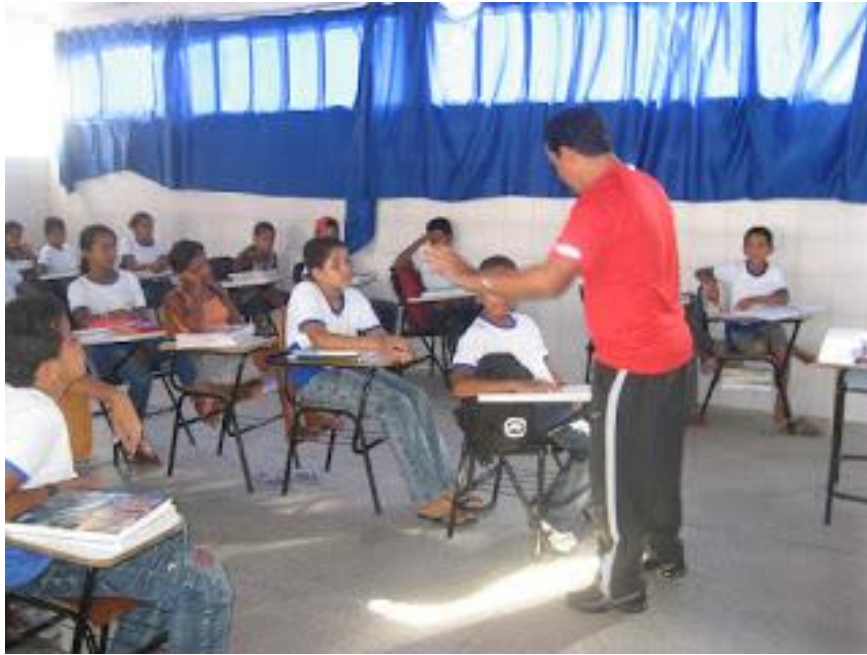
Figura 4 da aplicação de questionário aos alunos do 5º ano A. Acervo da Escola Municipal Cecílio Eugênio Alves.