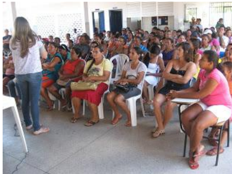
Figura 3 da aplicação de questionário aos pais e mães de alunos. Acervo da Escola Municipal Cecílio Eugênio Alves.