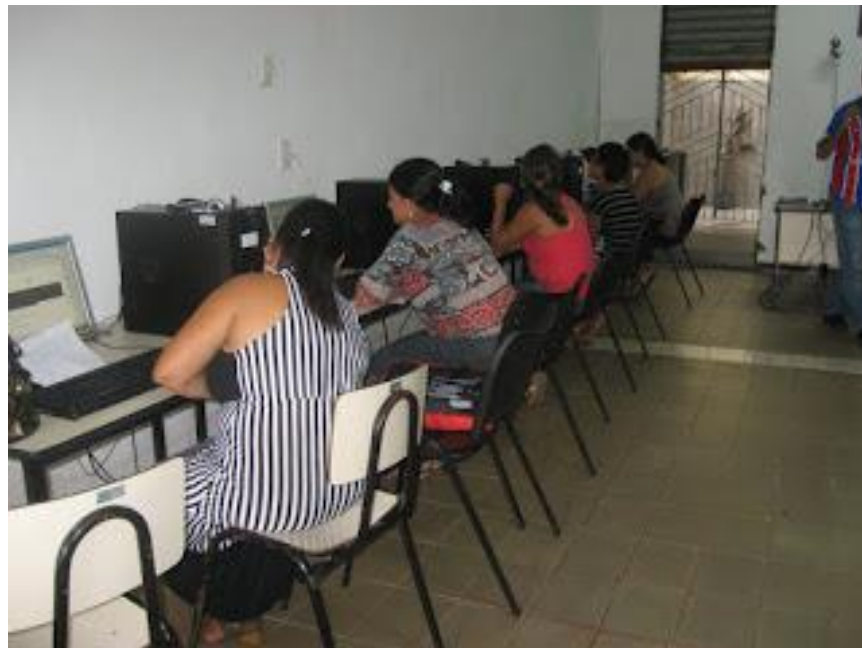
Figura 5 da aplicação de questionário aos profissionais operacionais.