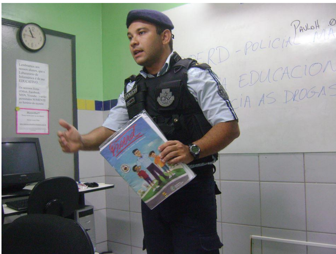
Figura 1 - Agente multiplicador do Programa de Resistências às Drogas, ministrando formação sobre as drogas aos alunos da Escola Municipal Cecílio Eugênio Alves no de 2013 e que serviram como ponto de referência quanto ao conhecimento dos alunos em relação as drogas.

Ainda, soubemos da ação do PROERD (Programa Educacional de Resistência às Drogas e à Violência) que atuaram por meio de palestras e oferta de materiais informativos contra as drogas. Ação representada em foto cedida e integrada a este texto em que o agente multiplicador, policial, estava a trabalhar o tema da droga por meio de palestra.