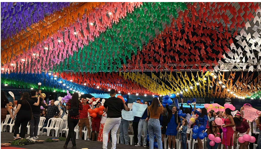
Figura 3: Torcidas das candidatas à Rainha da Mandioca

Uma das etapas da seleção é realizada pela comissão organizadora, que escolhe 10 finalistas para participar de um desfile oficial, no qual a rainha é escolhida por cinco jurados, conforme critérios estabelecidos no edital, sendo o de conhecimento sobre a cultura lagartense um dos principais. Existe também uma votação pública, realizada via enquete no perfil da prefeitura no Instagram , em que a mais votada recebe pontos a mais na classificação final. As três classificadas ganham prêmios em dinheiro (como ajuda de custo, conforme determina a Lei Municipal nº 858/2019) e em brindes ofertados por lojistas locais.