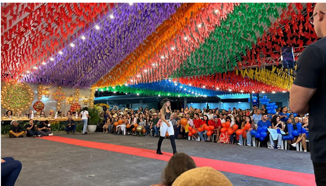
Figura 4: Desfile das candidatas

critérios como beleza, simpatia, desenvoltura e conhecimento sobre Lagarto. A contribuição foi de R$5.000,00 em prêmios, distribuídos entre as três primeiras colocadas. Houve também uma novidade no concurso, a eleição da Princesa da Mandioca 2025, como forma de ampliar a representatividade da cidade com diversidade e inclusão. O evento contou também com apresentações culturais, como o espetáculo “Quintais” do Projeto Arte no Cepard; a apresentação do ballet do Centro de Dança e Treinamento Tia Aila; a quadrilha Raio da Silibrina; e um show de um artista local, o Hudson Andrade.