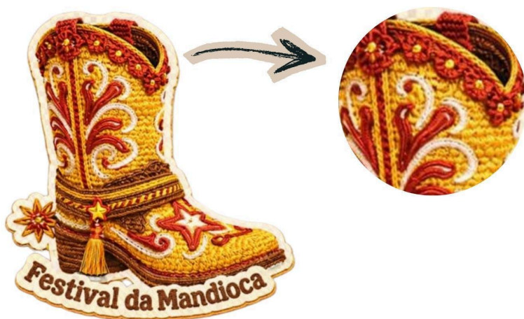
Figura 11: Ícones com formato de adesivos

Os ícones foram projetados também com a estética de crochê e de adesivos, a imagem da bota com um detalhe ampliado serve como base de modelo. Os demais, serão apresentados abaixo em tamanhos menores para não ocupar muito as páginas, mas todos seguem o mesmo estilo em o mesmo estilo.