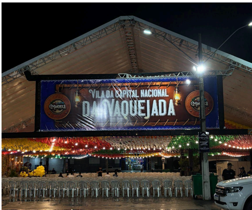
Figura 6: Placa de entrada da Vila da Capital Nacional da Vaquejada