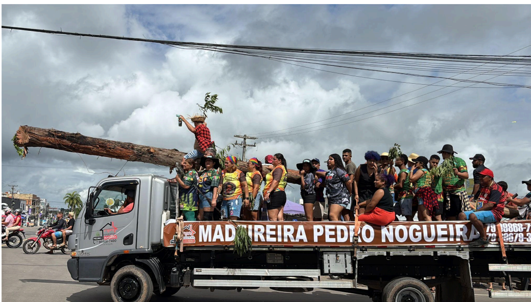
Figura 2: Mastro sendo cortejado pelas ruas da cidade até a Avenida Bica