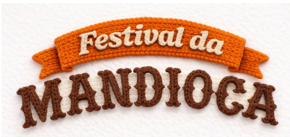
Figura 10: Logo do Festival da Mandioca

O intuito é manter a faixa que vem se tornando característica das logos recentes do festival, dar o tom acolhedor com a primeira tipografia sendo mais arredondada e a segunda remete a uma tipografia mais rústica de vaquejada, mantendo a tradição. O crochê, como explicado acima, é uma sugestão de estética visual que combina com o objetivo de acolher, conectar e ainda acompanhar uma das tendências de design de 2026, conforme um relatório de previsões do Pinterest , respaldadas no retrô e em selos.