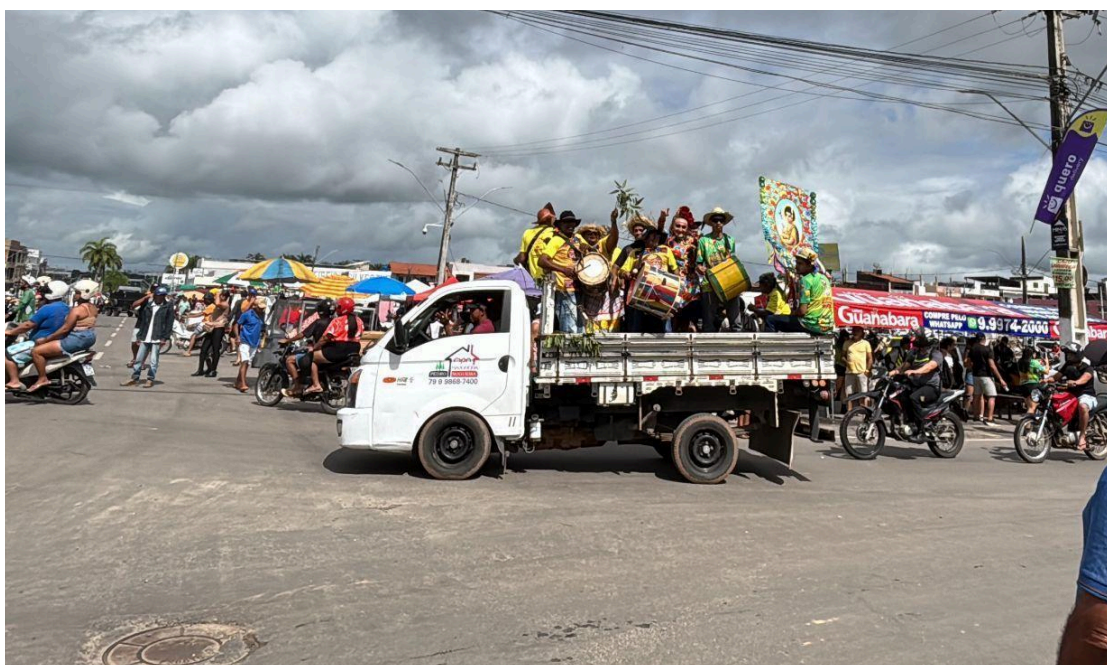
Figura 1: Grupo de Zabumba abrindo o cortejo do Mastro