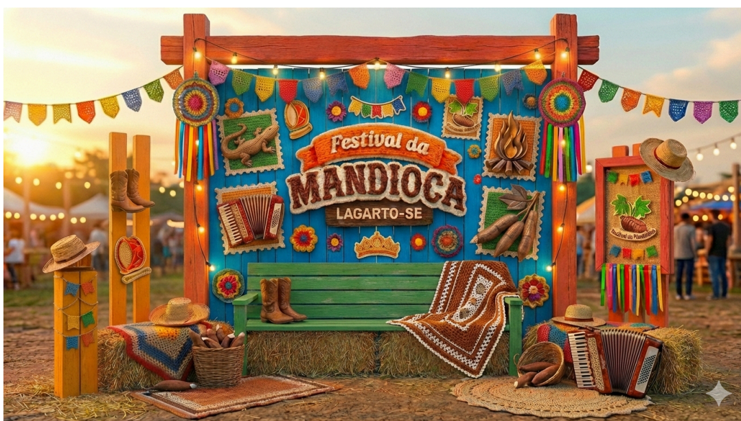
Figura 12: Mockup de Painel Instagramável