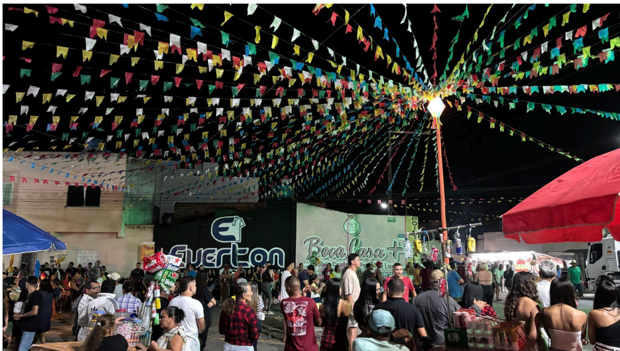
Figura 9: Público do Forró da Rua Laranjeiras