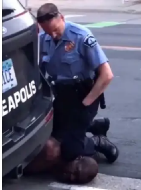
Figura 7 - Cena do vídeo do assassinato de George Floyd