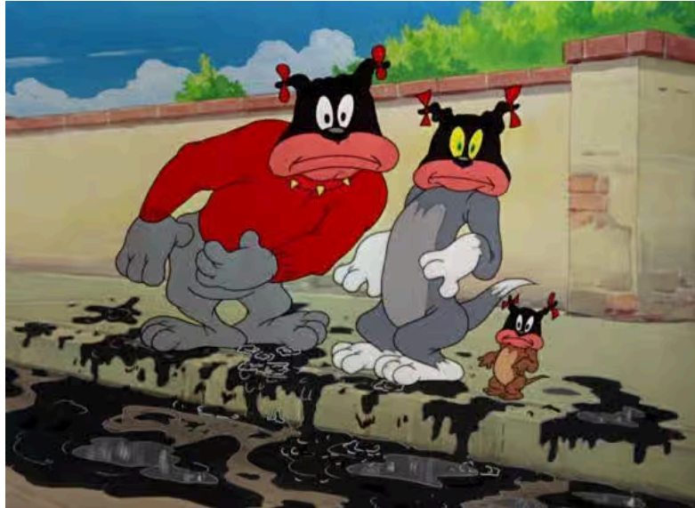
Figura 4 - Cena de Tom e Jerry antes da censura

podem retratar alguns preconceitos étnicos e raciais que já foram comuns na sociedade americana. Tais representações eram erradas naquela época e são erradas hoje." Não são todos os episódios que contém esse aviso, mas o segundo volume completo vem acompanhado dessa advertência.