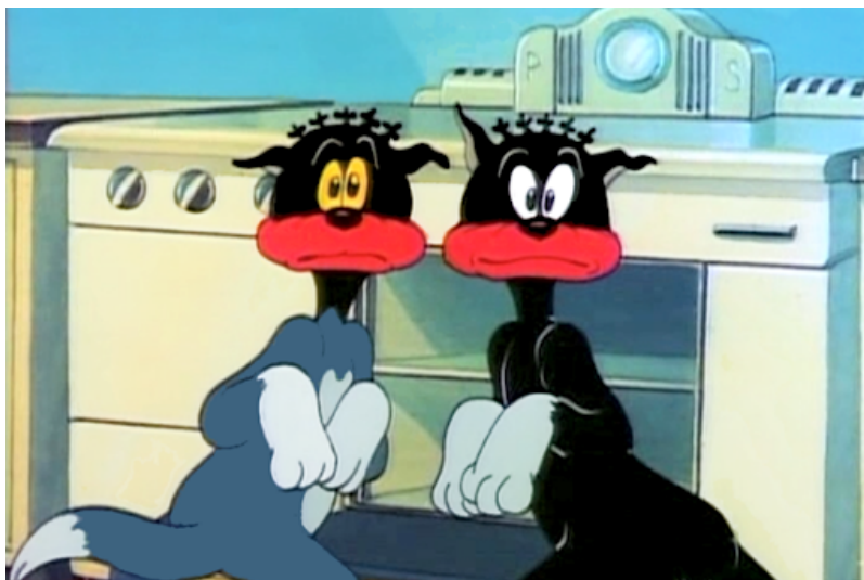
Figura 5 - Cena de Tom e Jerry antes da censura