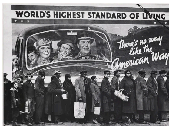
Figura 1 - "Fila do pão durante a inundação de Louisville, Kentucky"

De acordo com Cordeiro (2017) em "Memórias de uma beatnik: por um viés emancipatório", após o fim da Segunda Guerra Mundial, os Estados Unidos visavam se concretizar como um potência capitalista em expansão do seu mercado consumidor, lotando as pessoas de propagandas de artefatos inovadores e estilos de vida revolucionários a serem vendidos. Para que essa estratégia se tornasse ainda mais convincente, foi reforçado o slogan "American Way Of Life" para caracterizar os americanos como seres conservadores e que buscam o melhor para a sua família que já era utilizado no país. Os objetivos comerciais dos EUA eram atingidos com esse slogan devido à essa imposição de maneira sutil nos cidadãos de que, para atingir o conforto e qualidade de vida, você deve buscar adquirir bens materiais, assim, formando um ciclo vicioso em que as pessoas trabalham para gastar o dinheiro com a "felicidade" e precisam trabalhar cada vez mais para serem mais felizes e satisfeitos.