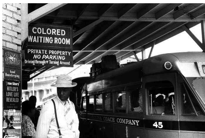
Figura 6 - Cartaz dizendo "Sala de espera para pessoas de cor" numa estação de ônibus

Nessa época, era comum que fossem avistadas cenas típicas de livros de História e que parecem completamente distantes da realidade devido às Leis Jim Crow: placas que demarcavam a segregação e delimitavam quais eram os ambientes que podiam ser ocupados por "pessoas de cor" espalhados pelas ruas. Apesar da exclusão ocorrer em todo o país, essas leis vigoravam principalmente na região do Sul dos EUA, onde concentrava-se a população negra.