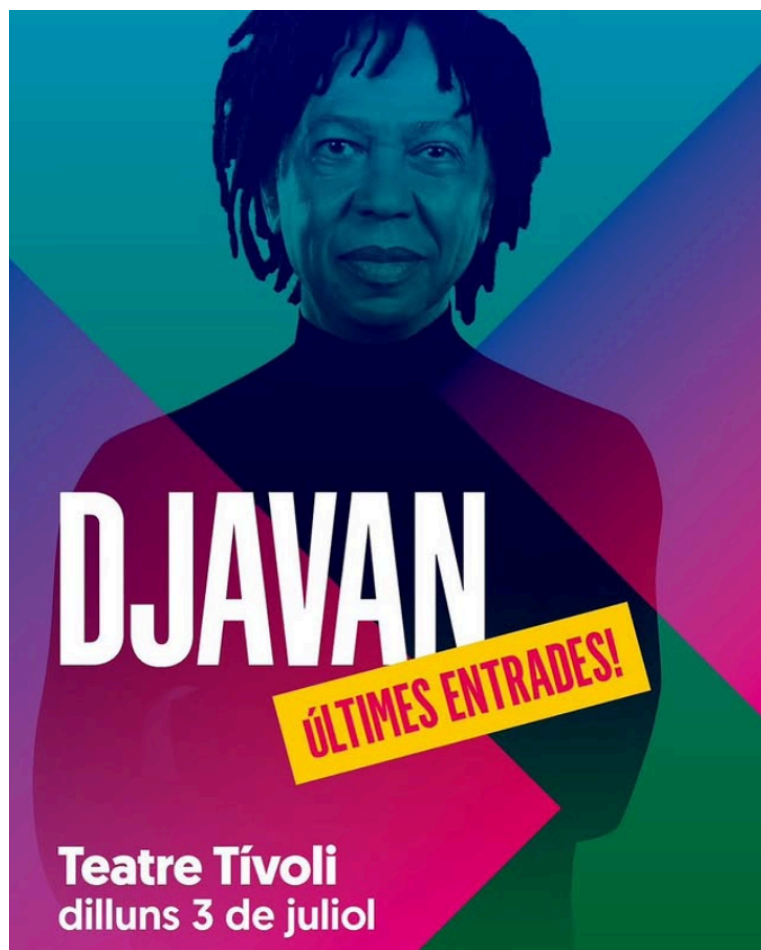
Figura 14 - Post de "Últimes entrades" do Djavan

imagem no perfil do cantor Djavan que divulgava "ultimes entrades" que significa "últimas entradas" em catalão, já que o show seria realizado em Barcelona. Porém, ao visualizar o post, os internautas associaram os termos à linguagem neutra e fizeram diversos comentários descredibilizando o cantor e a linguagem, como por exemplo: "Esse pessoal usa essa linguagem ridícula para aparecer. Toma vergonha Djavan!" e "Poderias traduzir o que seria ÚLTIMES ENTRADES? Não achei essas palavras no PRIMO AURÉLIO", de acordo com o G1.