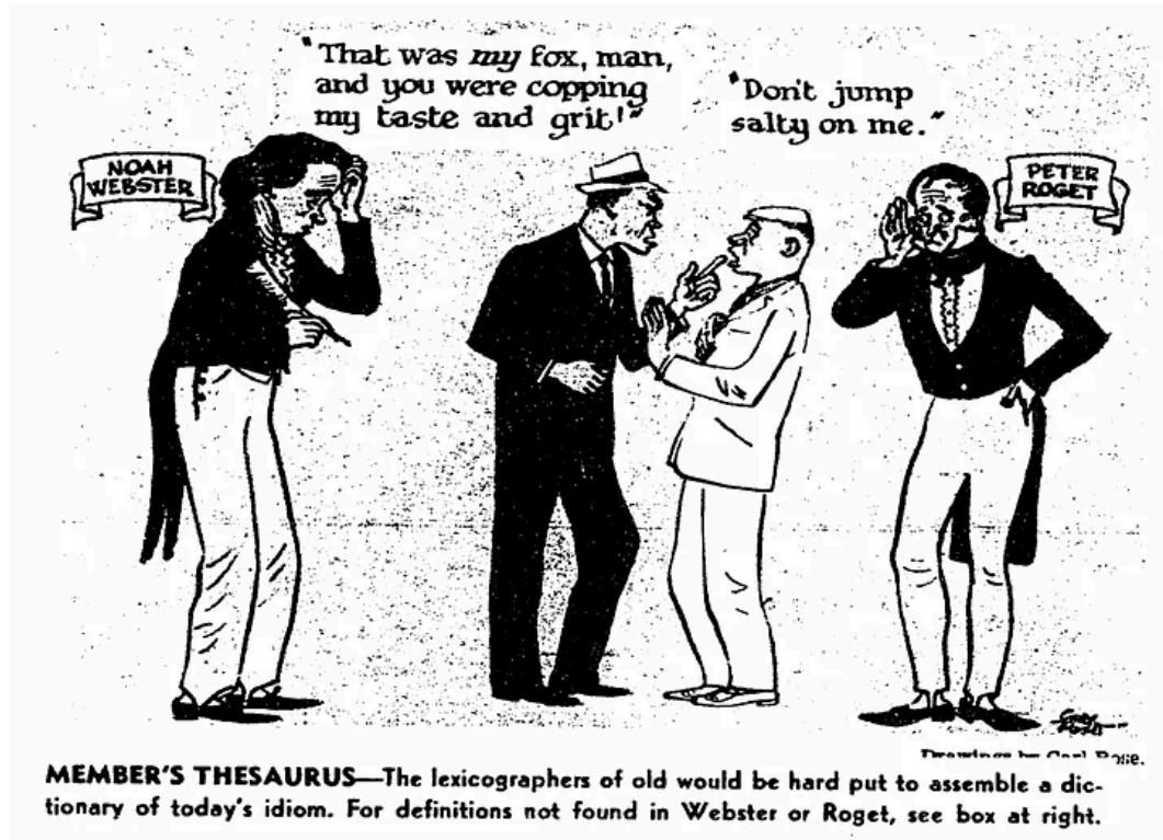
Figura 2 - Charge do artigo "If you're woke you dig it"

Voltando um pouco ao início do artigo de opinião, o primeiro elemento que é possível analisar é uma charge que complementar à temática: