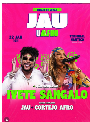
Figura 7 - Cartaz de Jau e Ivete