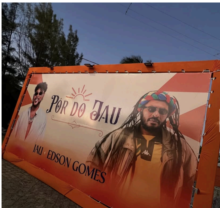
Figura 4 - Placa 1