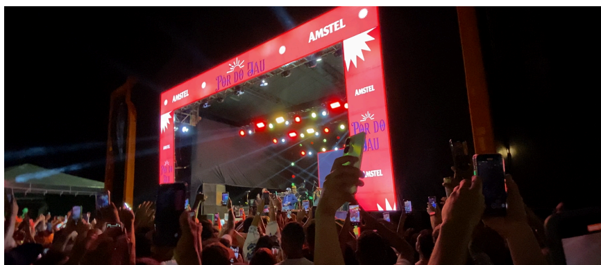
Figura 15 - Público filmando

As figuras 15 e 16 mostra o momento exato em que ocorre essa interação: