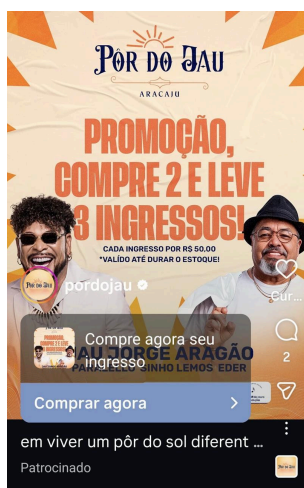
Figura 6 - Promoção

Um aspecto importante é que Jau sempre faz seus shows com outros artistas famosos como, por exemplo, Ivete Sangalo, Jorge Aragão, entre outros. O artista adota como estratégia de marketing na criação e divulgação de seus shows uma estratégia de marketing de aliança em que se une a artistas consagrados, conforme pode ser visto nas figuras abaixo. Um elemento importante a ser destacado é que no Pôr do Jau com Jorge Aragão em Aracaju houveram diversas promoções de até 50% do valor que podem indicar uma dificuldade maior em atrair o público, ao contrário, os shows com Edson Gomes foram lotados. A figura 6 apresenta o cartaz de promoção: