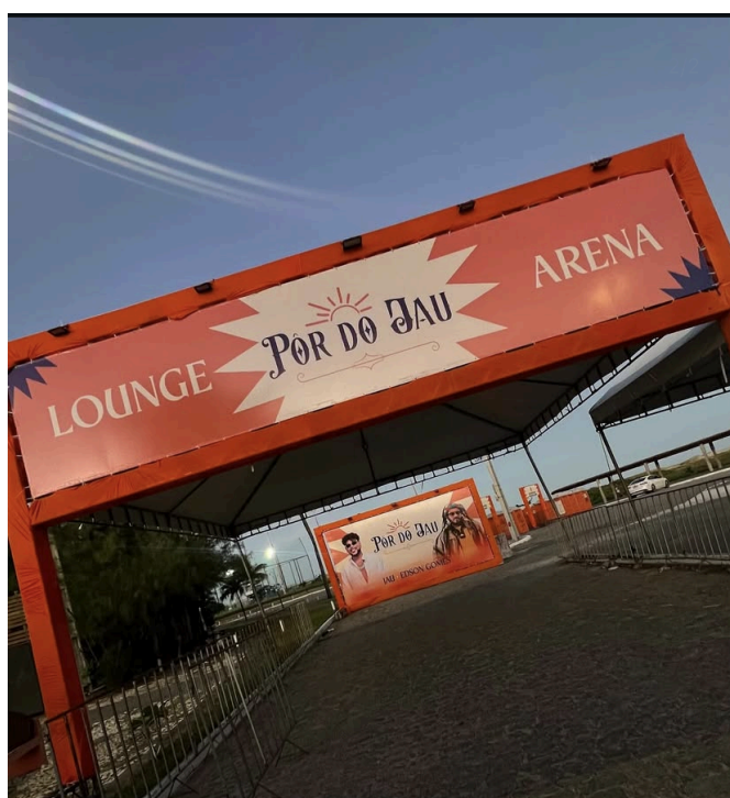
Figura 5 - Placa 2