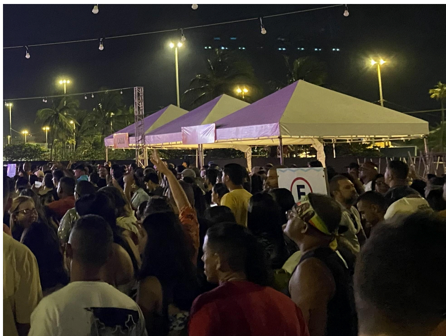
Figura 13 - Faixa de Edson Gomes II