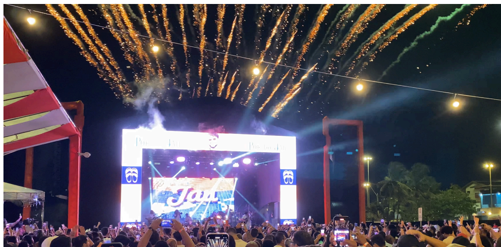
Figura 10 - Apresentação de Jau