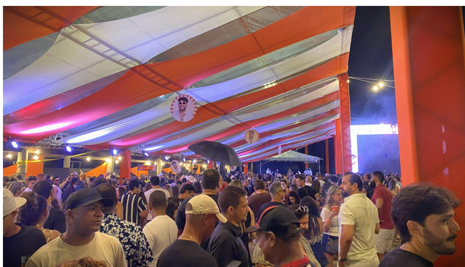
Figura 9 - Espaço VIP

A figura 9 exhibe as características do espaço, a tela, a estrutura personalizada com as cores da divulgação: