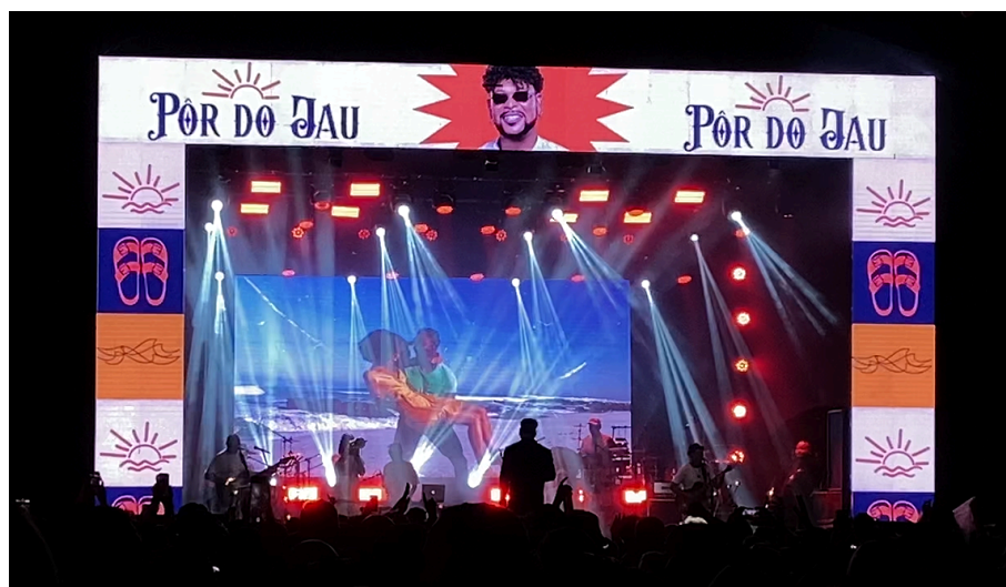
Figura 11 - Telão