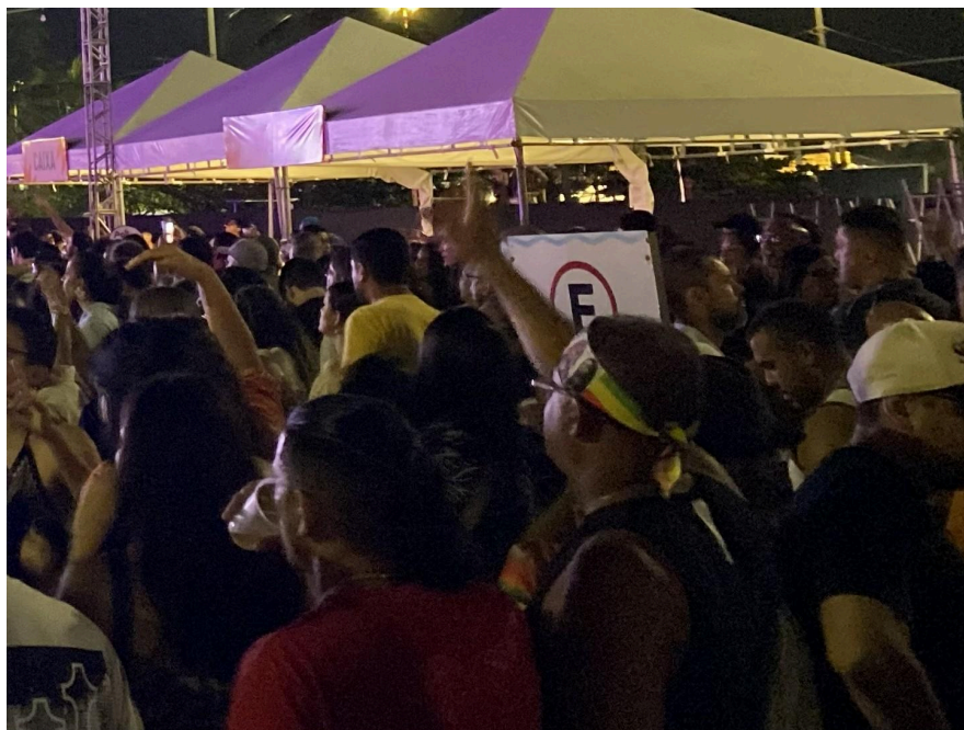
Figura 12 - Faixa de Edson Gomes

Gomes. Esse comportamento do fã de Edson Gomes, mesmo sutil, arrumando-se enquanto mexia o corpo no ritmo da música de Jau, mostra o real motivo dele estar ali, nesse caso, para acompanhar o convidado principal, o reggaeman Edson Gomes. As figuras 12 e 13 apresentam o fã preparado esperando o show de Edson Gomes: