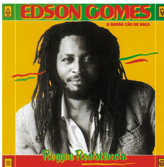
Figura 1 - Capa “Reggae Resistência”