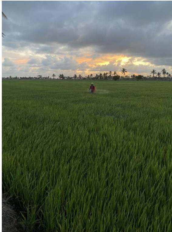
Figura 4. — Realização da pulverização no talhão avaliado.