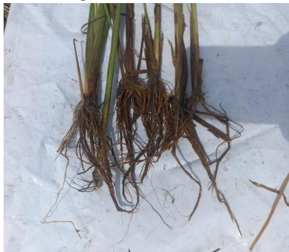
Figura 2. — Sistema radicular de planta de arroz com sintomas associados ao mal-do-pé.