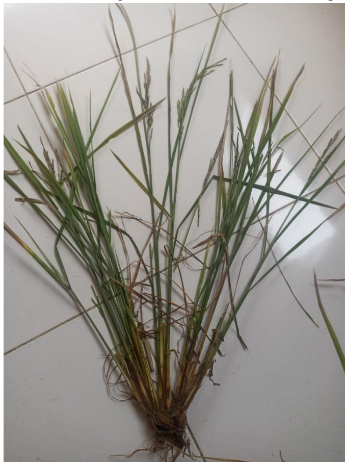
Figura 9. — Planta de arroz em estágio de senescência associada ao patógeno (mal-do-pé).