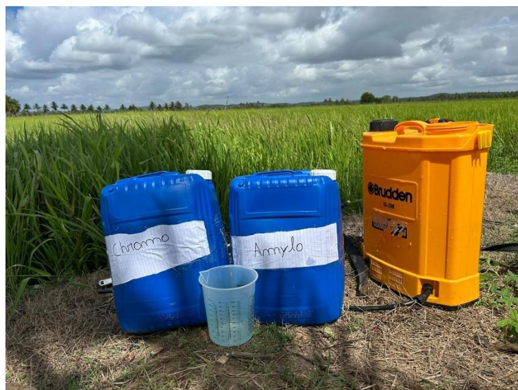
Figura 11. — Bomba costal elétrica e galões contendo multiplicados utilizados na aplicação.