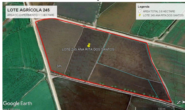
Figura 8. — Imagem do Google Earth Pro delimitando a área total do Lote Agrícola 245 e a área do experimento.