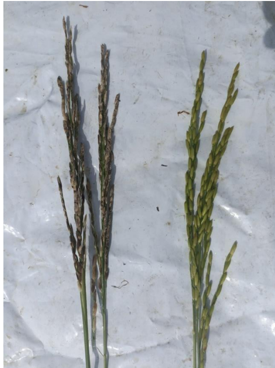
Figura 10. — Comparação entre panícula com sintomas (esquerda) e panícula saudável (direita) associados ao mal-do-pé.