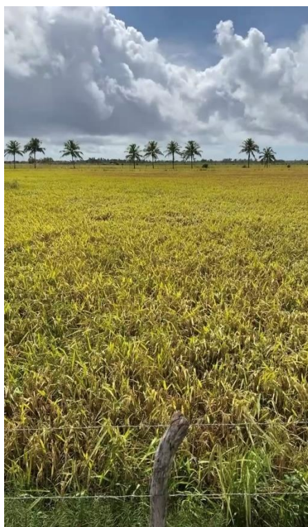
Figura 5. - Área tratada com os microrganismos.