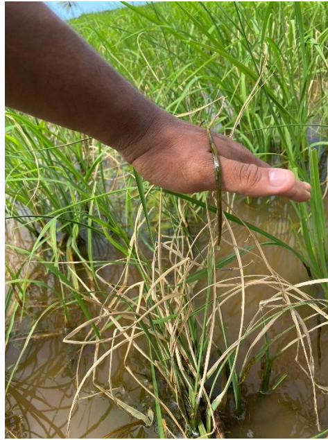
Figura 3. — Restos culturais com sintomas do patógeno do mal-do-pé.