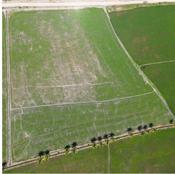
Figura 7. — Imagem aérea da área do experimento (talhão avaliado).