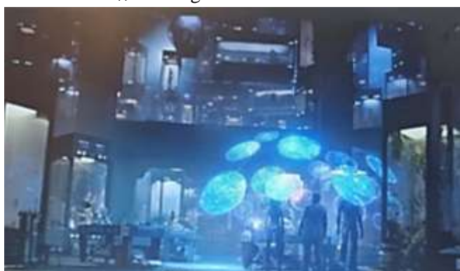
SE 44 - O surgimento das Joias do Poder

Na imagem abaixo, vemos que o personagem Tivan utiliza um equipamento de projeção para apresentar o surgimento das joias do infinito. Ele ocupa a posição de detentor do saber, pois possui o conhecimento (o saber) sobre a origem, a natureza e o funcionamento. Esse saber antigo e secreto é o que legitima seu poder e sua posição como “O Colecionador”. O discurso dele –“Antes da própria criação [...]” (SE 43 , Guardiões da Galáxia, 2014, 01:05:35)” é a materialização desse poder-saber. Para Foucault (2013, 2015a, 2015b) o poder e o saber estão diretamente imbricados. Não se pode exercer o poder sem o saber, e todo saber gera relações de poder.