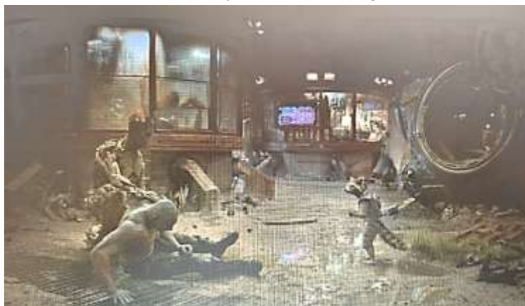
SE 27 - a intervenção silenciosa de groot

Após o episódio em que Drax quase foi morto por Ronan, Rocket é interpelado à movimentar-se para a FD do cuidado e da comunidade: