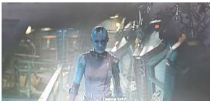
SE 21 - Nebulosa

O poder disciplinar de Thanos sobre Nebulosa não foi apenas sobre treinamento; foi sobre desmontagem e reconstrução literal. A competição imposta entre Gamora e Nebulosa fazia com que cada derrota de Nebulosa fosse punida com a substituição de uma parte de seu corpo por uma estrutura cibernética. Seu corpo tornou-se um campo de batalha material onde a “superioridade” de Gamora era inscrita através da mutilação.