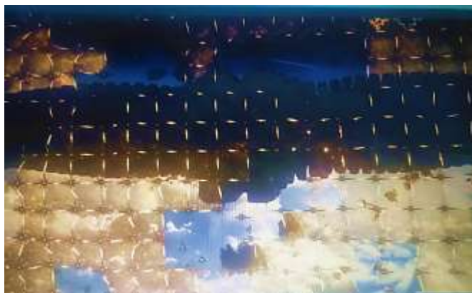
SE 45 - O bloqueio a Dark Aster

Podemos entender que o estado neoliberal não “deixa morrer” como Ego faz com os filhos falhos ou as populações, mas retira as redes de proteção (precarização da saúde pública, educação, previdência, condições de trabalho, etc.) e deixa os sujeitos competirem pela própria sobrevivência. Dessa forma, a morte, o sofrimento tornam-se “danos colaterais” da busca pela eficiência econômica ou bélica.