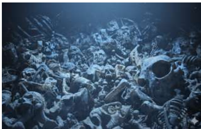
SE 11 - Cemitério de Ossos dos filhos de Ego

Dessa forma, Ego, assim como o soberano tem o poder de “fazer morrer e deixar viver” (Foucault, 1988, p. 127) . Ele cria vidas e destrói mundos inteiros para alimentar o projeto que nomeia de “expansão”. Sua existência, portanto, configura a negação absoluta do biopoder (que busca administrar a vida), afirmando-se como um poder de governamentalização da morte ou tanatopolítica 22 . Nesse contexto, não há espaço para a diferença ou dissenso; Ego se investe de uma subjetividade absoluta que busca transformar todos os outros (inclusive os seus filhos) em extensões de seu próprio ser: ego é a sua lei, sua verdade e sua justificativa (o seu projeto é a extensão de sua consciência).