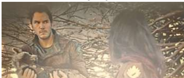
(Guardiões da Galáxia, 2014, 0:24:31)