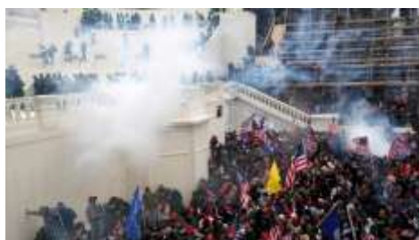
SE 35 – Invasão do Capitólio

As imagens abaixo retomam, sequencialmente a invasão do Capitólio 28 , a invasão da sede dos Três Poderes 29 e a invasão de Xandar: