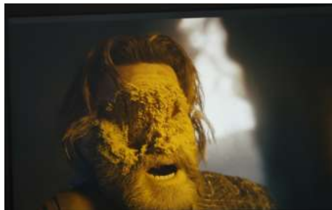
SE 3 - Desintegração de Ego