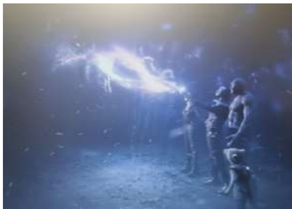
SE 2 - Desintegração de Ronan

Isso caracteriza a composição do multiverso. A ideia nos remete à perspectiva da teoria da Física Quântica 16 , com o entendimento de um mundo no qual uma partícula pode estar em lugares diferentes ao mesmo tempo e pode se mover de um lugar para o outro explorando simultaneamente o universo. Como exemplo dessa perspectiva, podemos citar a desintegração de Ronan, o Acusador, em Guardiões da Galáxia (2014) e de Ego, em Guardiões da Galáxia , vol. 2 (2017).