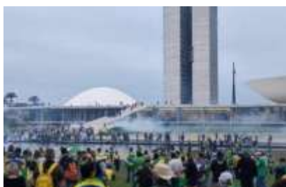
SE 36 – Invasão da Sede dos Três Poderes SE 37 – Invasão de Xandar