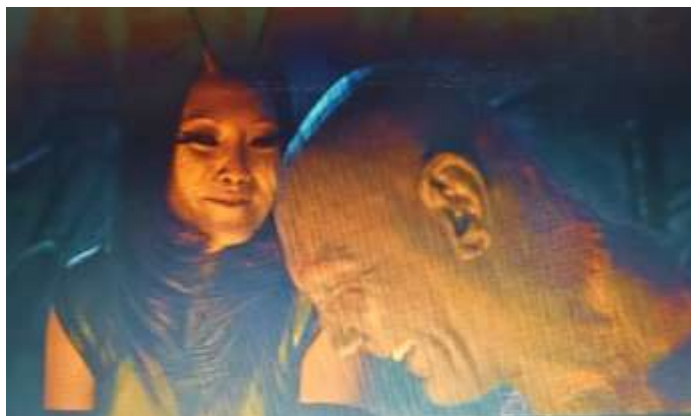
SE 24 - Mantis socializando com os Guardiões

A mudança e/ou o rompimento da FD predominante acontece a partir do encontro com os Guardiões: