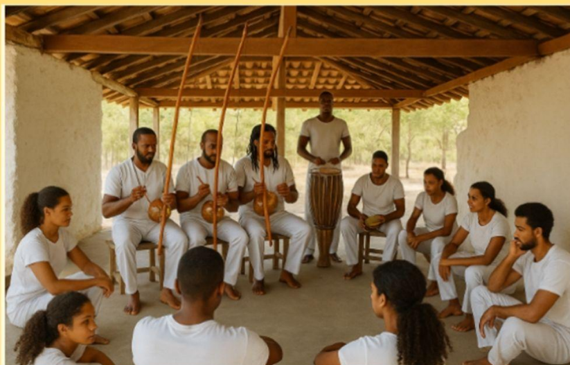
Imagem gerada por IA (Gamma), julho de 2025.

Para o ensino de história da diáspora africana no Brasil, é indispensável saber que as metodologias de ensino das comunidades de tradição oral devem ser levadas em consideração, visto que se trata de maneiras lúdicas de transmissão do conhecimento. Fonseca (2022), corrobora com a ideia de que as danças, as músicas, e as palavras cantadas e narradas são instrumentos de transmissão de histórias e saberes, vindos em diáspora da África para o Brasil. Desta forma, a implementação de uma educação que respeite a maneira que os africanos e seus descendentes se vêm no mundo, requer a presença desses elementos.