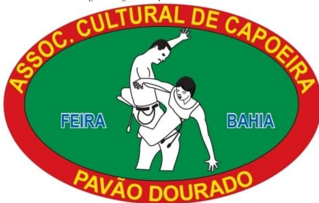
Figura 3-Slogan do Grupo Pavão Dourado