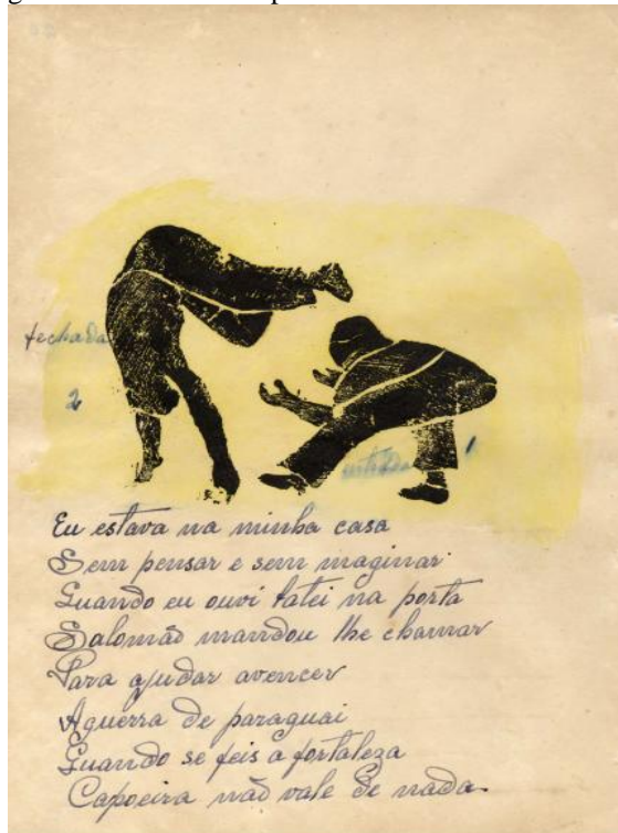
Figura 4-Ladainha de capoeira sobre a Guerra do Paraguai

Fonte: Manuscritos de Mestre Pastinha, 2003.