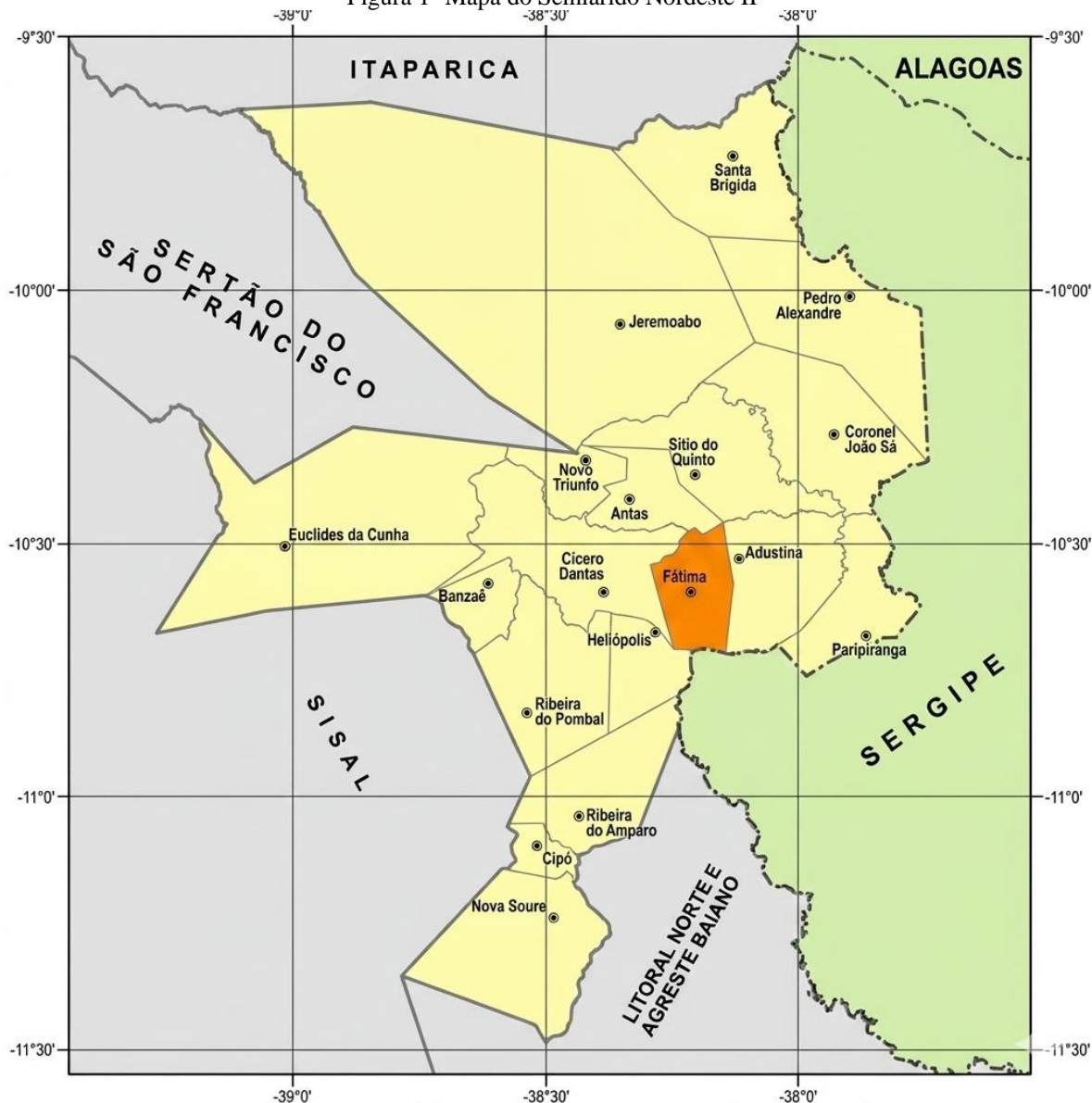
Figura 1- Mapa do Semiárido Nordeste II