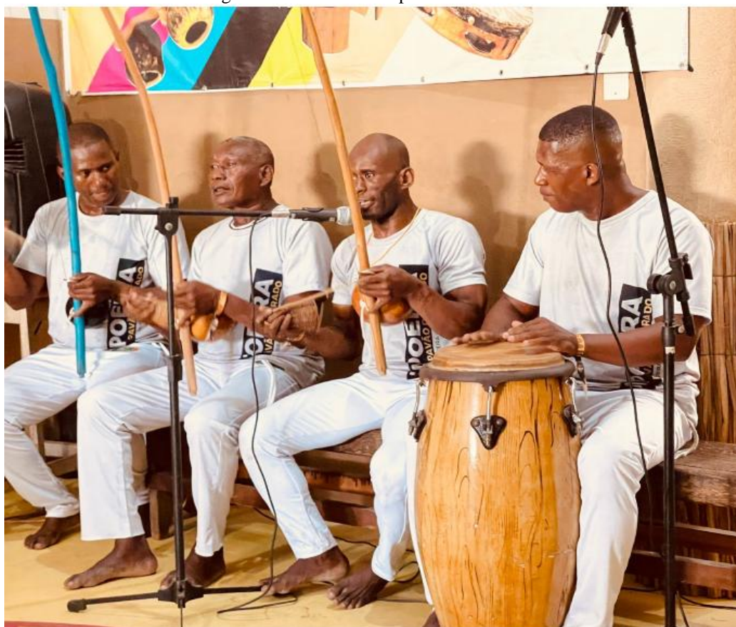
Figura 2-Mestres Do Grupo Pavão Dourado