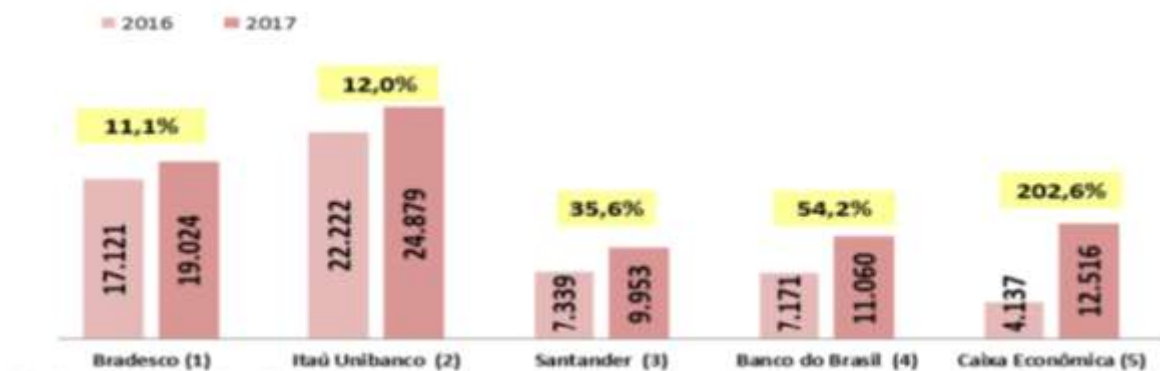
Gráfico 2 – Lucro líquido dos cinco maiores bancos no Brasil no biênio 2016-2017 (em R$ milhões)

Um outro indicador que evidencia a disparidade com o cenário de retração econômica é a última pesquisa do Departamento Intersindical de Estatísticas e Estudos Socioeconômicos (DIEESE, 2018, p. 6) acerca do lucro líquido das cinco maiores instituições bancárias que atuam no Brasil: