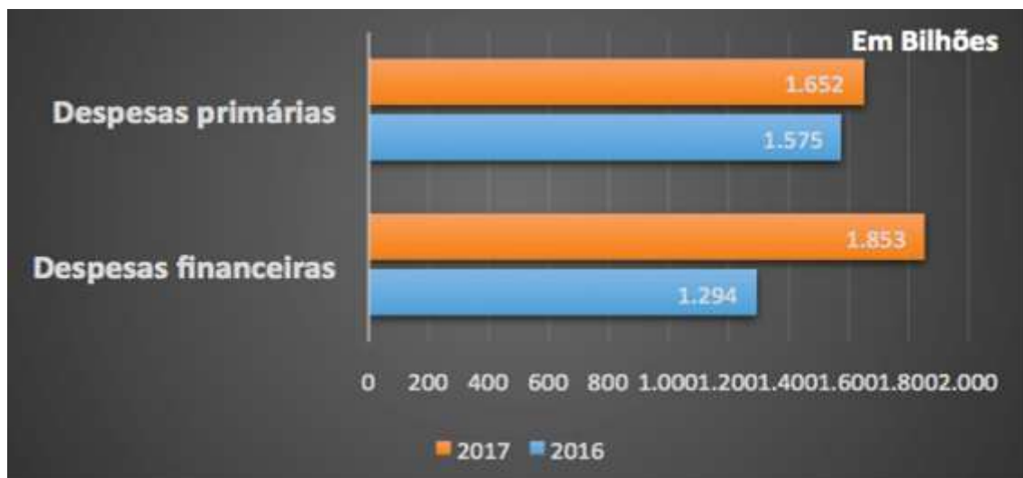
Gráfico 3 – Despesas Primárias e Financeiras no biênio 2016-2017

Outro instrumento, acoplado recentemente na Constituição para dar vantagens aos especuladores sob o pretexto de diminuir os gastos públicos e equilibrar as contas públicas, é a polêmica Emenda Constitucional 95/16, outrora chamada de “PEC do teto de gastos” que restringe em 20 anos os gastos primários com saúde, educação, habitação, por exemplo, de cada ano ao aumento da inflação do ano anterior, medida pelo Índice Nacional de Preços ao Consumidor Amplo (IPCA) mas que mantém incólume o pagamento de despesas financeiras, como o serviço da dívida e seu refinanciamento. Segundo análise de dados, extraídos do Portal SIGA Brasil, feita pelo Instituto de Estudos Socioeconômicos (Inesc, 2017):