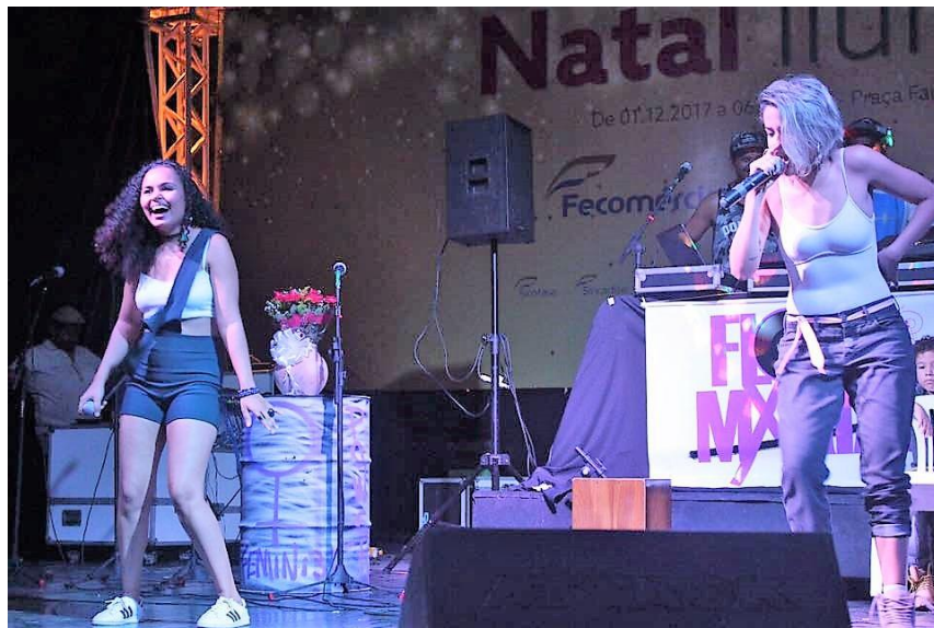
Imagem 4: Apresentação do grupo Flor Marias no projeto Sescconção.

A produção musical da maioria dos grupos de rap, parece ser quase sempre marcada por um tom de protesto e de indignação. Desse modo, esses grupos preocupam-se em denunciar os contrastes sociais a partir de vários temas. No caso do Flor Marias, a dupla mostra-se consciente em relação às questões que envolvem o universo feminino, o que faz com que tal perspectiva seja ressaltada em suas produções musicais. Assim, entendo que os temas retratados ainda são frutos de uma escolha coletiva que envolve inclusive o produtor do mesmo.