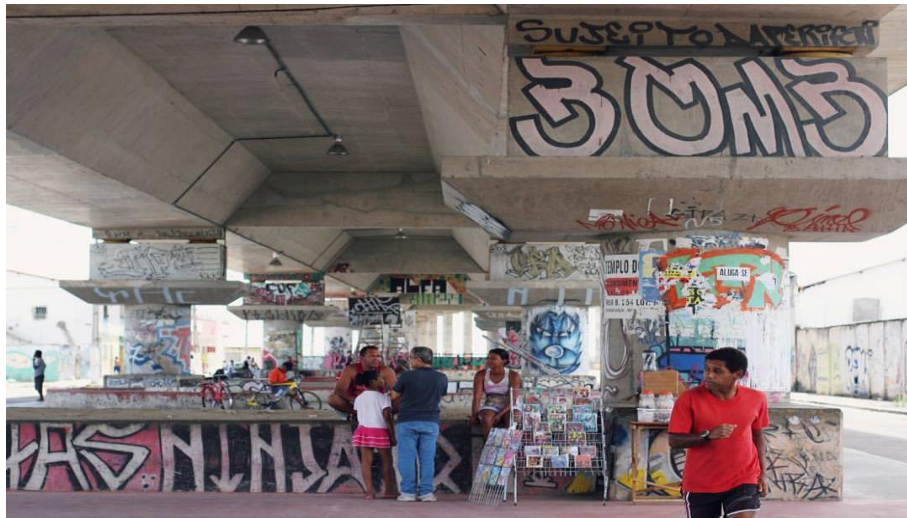
Imagem1: Ponte Construtor João Alves