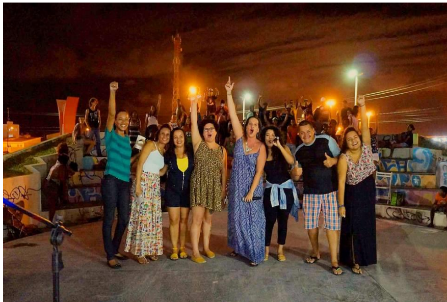
Imagem 11: Integrantes da FNMH 2 e convidadas no evento Rima D'Mina.

Fonte: Página da Frente de Mulheres do Hip Hop em Sergipe 23