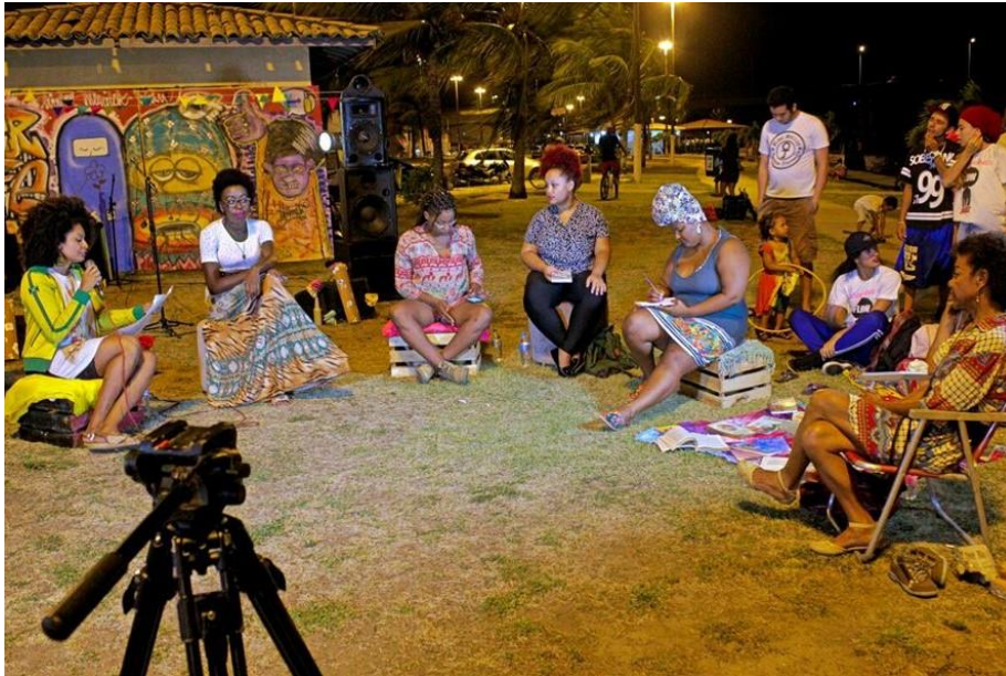
Imagem 15: Roda de conversa realizada por integrantes de coletivos feministas