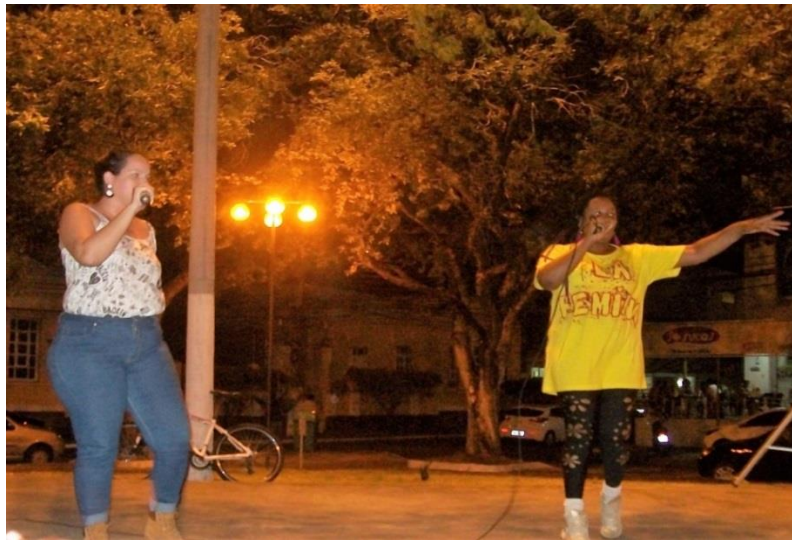
Imagem 5: Integrantes do grupo La Femina no ato contra Pec 241

Minas contra o sistema Esse é o lema nada pode nos parar Minas de atitude mas não se ilude Somos mulheres somos pretas de atitude (...) Rimas progressivas, combativas, alucinantes. é a mulher que manda rima no real instante procurando nosso dom você pode não ver mas eu vou te mostrar que tenho rima e proceder