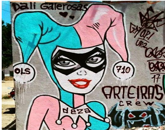
Imagem 9: Alerquina Galerosa