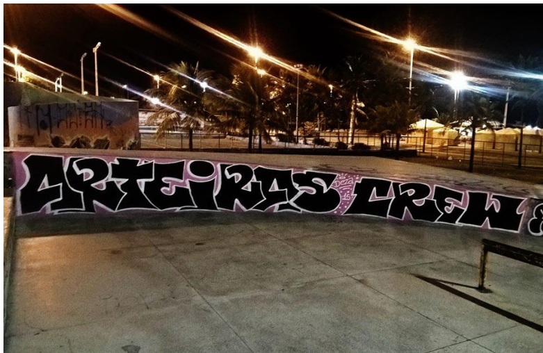
Imagem 8: Grafite produzido na Orla de Atalaia em Aracaju