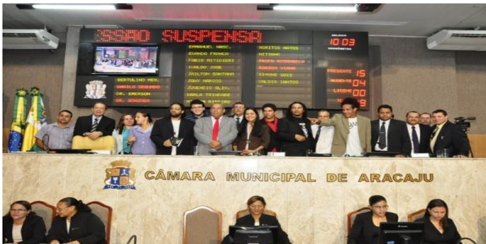
Imagem 2: Abertura da Semana de Hip Hop