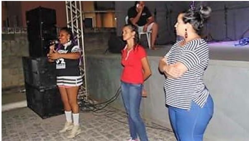
Imagem 18: Debate sobre cultura do estupro no evento Salve Favelas

Fonte: Página da Frente Nacional de Mulheres do hip hop em Sergipe 27