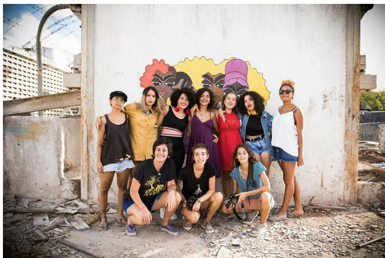
Imagem17- Mulheres reunidas para gravação da Cypher “Conto do Vigário”