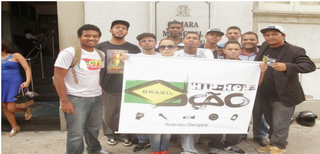
Imagem 3: Integrantes após abertura da Semana Municipal de Hip Hop