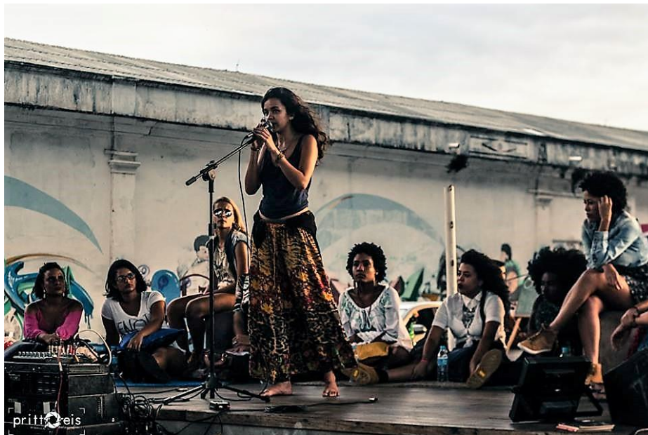
Imagem 14: Roda de poesia realizada durante o evento Mulheres de Luta