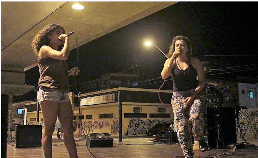
Imagem 16: Apresentação do grupo Guerrilheiras na 3ª edição das Mulheres de Luta