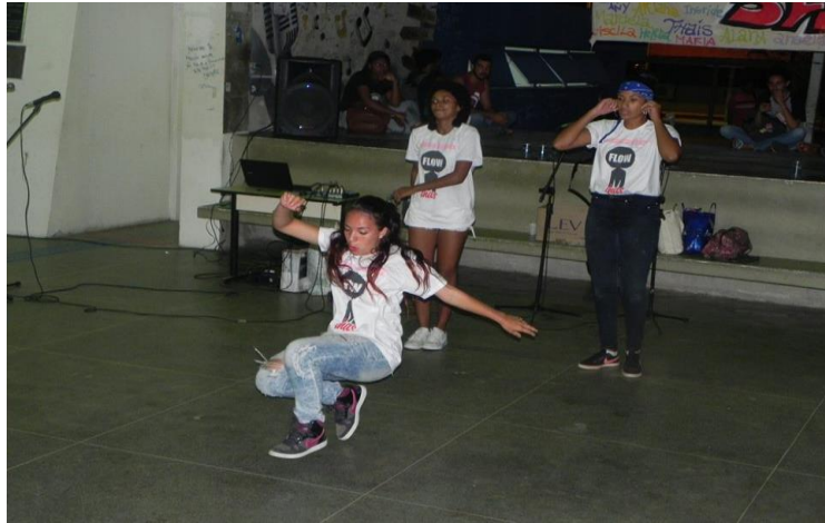
Imagem 10: Crew Flow Minas na Semana de Luta contra a violência à mulher

Fonte: Página do Sindicato dos trabalhadores técnicos administrativos em educação- UFS 22