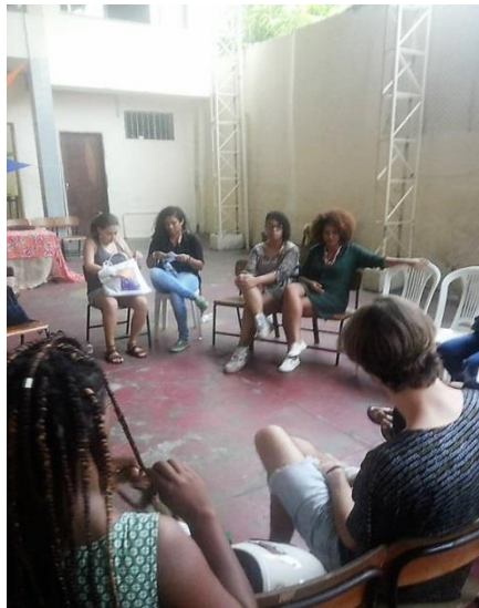
Imagem 12 e 13: Integrantes da FNMH 2 e participantes do Fórum