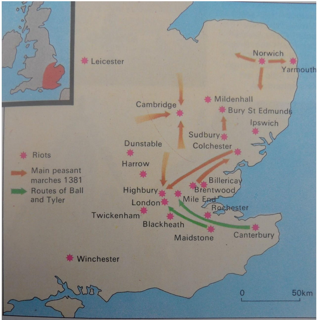
Focos de rebelião durante a Revolta Camponesa de 1381

Ou seja, por diversos lugares, rebelião e insurgência se encontravam em estado de ebulição, como também mostra este mapa abaixo: