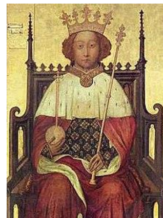
Imagem de Ricardo II

Com a morte de Eduardo III e do Príncipe Eduardo, o trono é assumido por Ricardo II na manhã de 16 de julho de 1377, na Igreja de São Pedro (hoje conhecida como Abadia de Westminster) em Westminster, com apenas 10 anos e assumindo um reino bastante turbulento. Sobre sua coroação, Ormrod diz que “não ofereceu nenhuma esperança real de remissão e, de certa forma, tornava a coroa ainda mais vulnerável à crítica política e popular”. 8 Seu governo será marcado por constantes conflitos, sendo os picos mais altos: a Revolta Camponesa de 1381; o parlamento de 1386 que repetirá o que fora realizado no “Good Parliament” de 1377 e realizará o impeachment de membros da administração real de Ricardo; as constantes disputas contra a oposição baronial, que levarão à sua deposição em 1399 por Henrique IV, até então Duque de Hereford e pertencente à dinastia Lancastre. 9