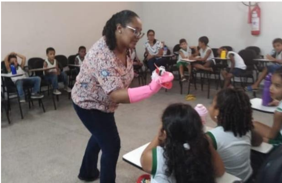
Figura 2 – Contando histórias na sala de aula