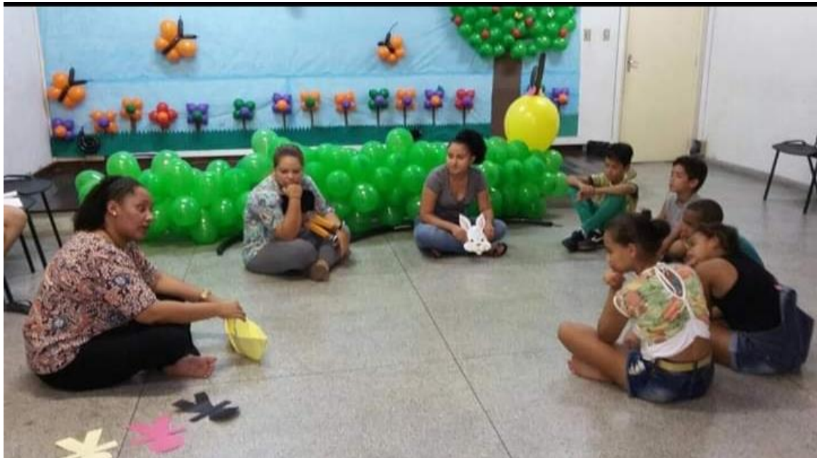
Figura 1 – Contando histórias na biblioteca