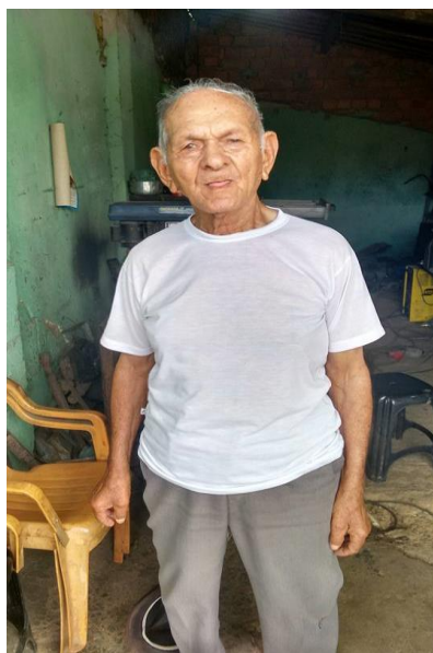
Figura 11