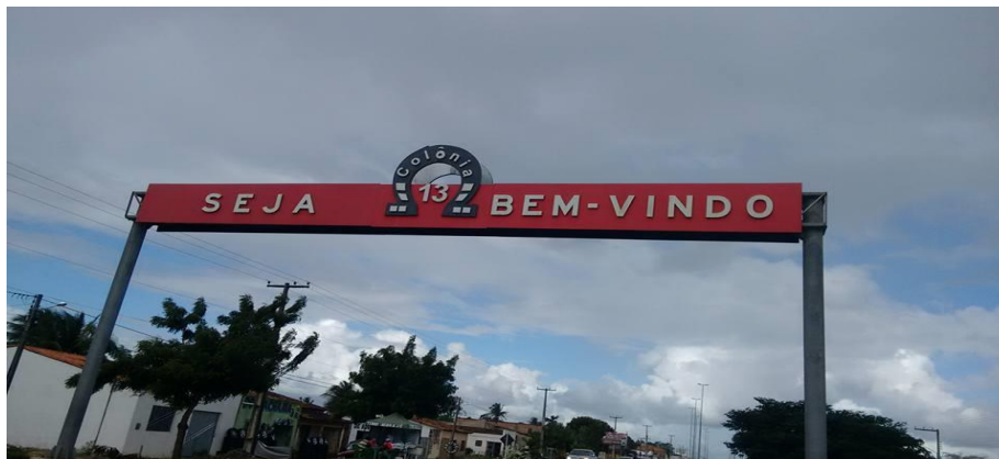
Figura9: Foto da entrada do Treze

de eventuais candidatos políticos, um eleitorado de também aproximadamente, 12 mil eleitores. Na economia, ainda persiste a força da agricultura (fumo, laranja, mandioca) em sintonia com o crescimento veloz do comércio urbano (lojas, empresas, clínicas). Isso tudo faz o Treze ter um porte de várias cidades de pequeno porte de Sergipe, nem todas as cidades tem uma saudação na entrada e na saída, mas a colônia tem e bem bonita.