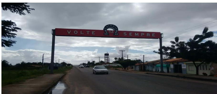
Figura 10: Foto da Saída do Treze.