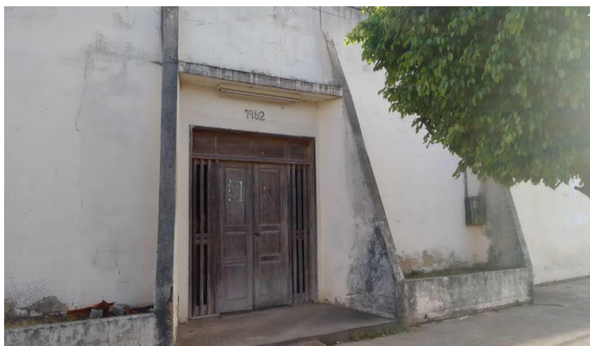
Figura1: Sede da Cooperativa