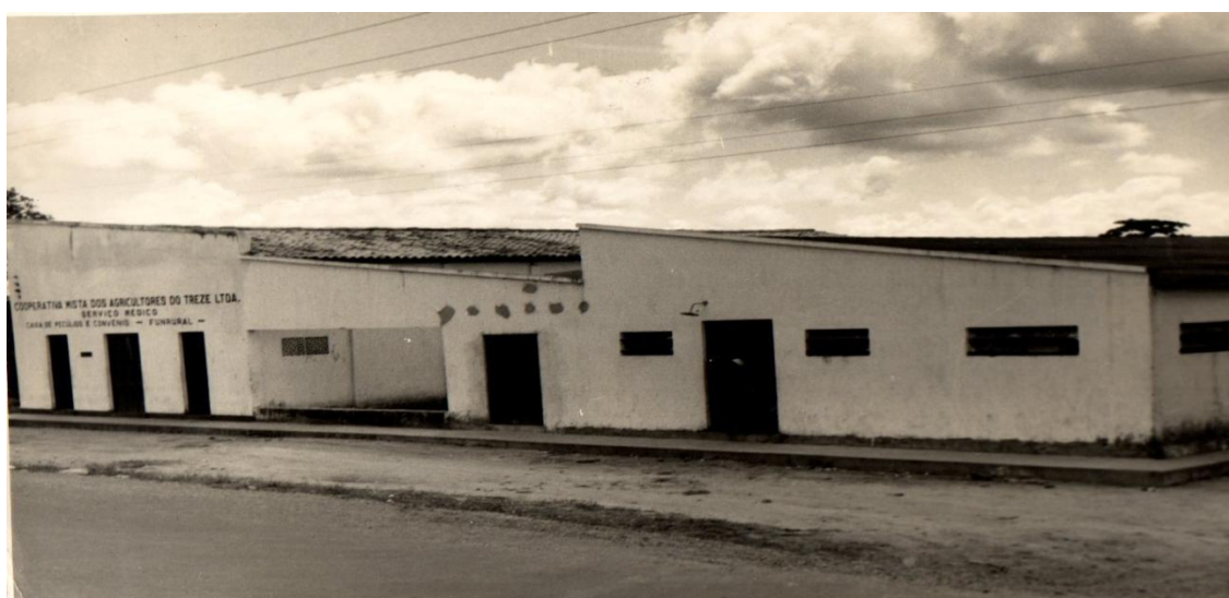
Figura 3: Centro de Assistência Médica (FALTA A FIGURA)

Ao longo dos anos a Cooperativa foi adquirindo novos bens e aumentando seu patrimônio. Com isso, sua atuação na área social ia aumentando como: educação e saúde passaram a ser prioridades. Assim, os serviços de assistência social, médica, educacional e outros foram contemplados com recurso de convênios firmados para o fim. Os serviços médicos são: odontológicos, de laboratórios, inclusive ambulância para remoção de paciente em estado grave, são direitos dos associados através da Caixa de Pecúlio (onde o associado paga uma taxa a mais para ter direitos a esses serviços) que são da Cooperativa.