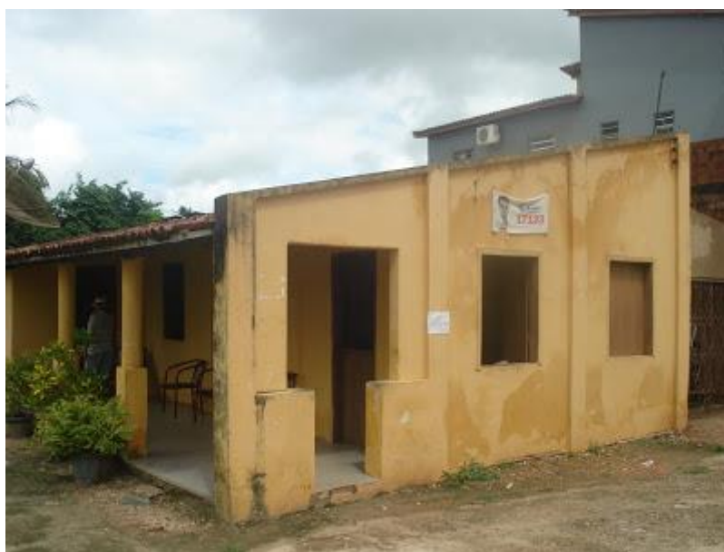
Figura 7. Casa padrão da época

Os agricultores que receberam a terra fizeram um esforço para que a colonização desse certo, canalizando esforços para que a produção do fumo crescesse na região, utilizando a mão de obra familiar, onde os excedentes eram comercializados nas redondezas. O cultivo do fumo é uma atividade onerosa e requer muita mão de obra, por isso a ajuda mútua foi largamente utilizada pelos produtores, como estratégia de ampliação de sua área de cultivo e consequentemente para obterem maiores lucros. Prática essa que consistia na simples troca de dias de trabalho, o que funcionava da seguinte maneira: todos os produtores possuíam certos chamados “sócios”, estes também produtores rurais do Treze. Cada sócio responsabilizava-se por fornecer um dia na semana ao outro sócio e assim respectivamente. Deste modo, esses pequenos agricultores montaram uma estratégia de produção fumageira, naquela época fez a diferença em relação às outras comunidades existentes na região de Lagarto.