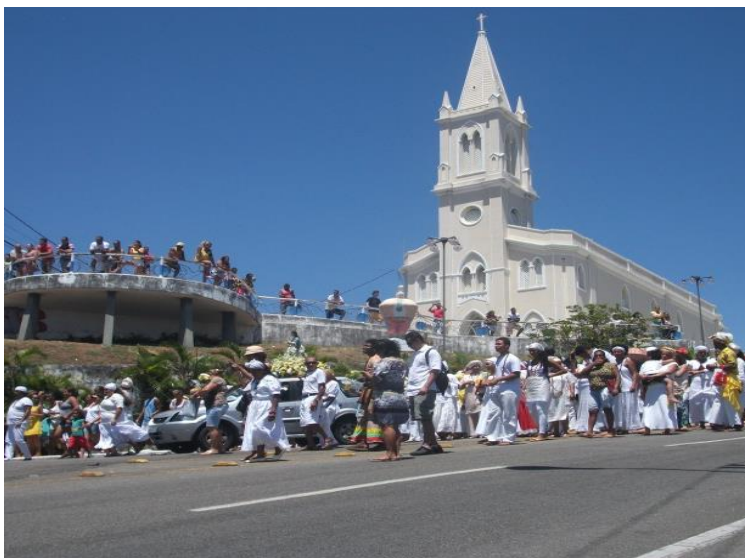
Figura 3 – Cortejo se iniciando e o contraste ente duas religiões.