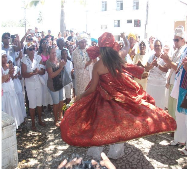
Figura 2 – Ritual de início

O ritual é iniciado com a abertura de uma roda na praça da colina, onde todos os pais e mães de santo foram convidadas a participar e estar ao lado da mãe de Santo organizadora da festa. Várias apresentações em adoração a Oxum foram desenvolvidas neste momento que simbolizava o início do cortejo. Na figura 2, podemos observar este momento.