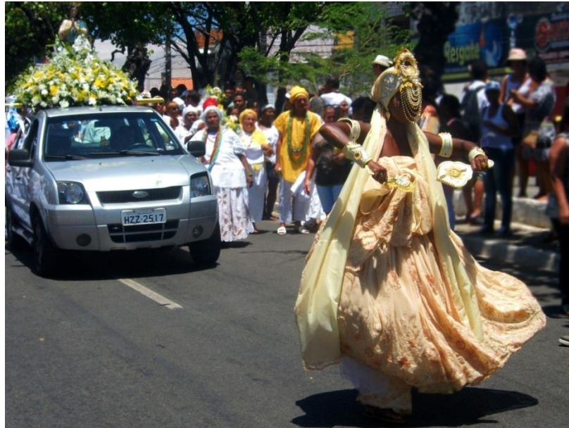
Figura 4 – Representação de Oxum