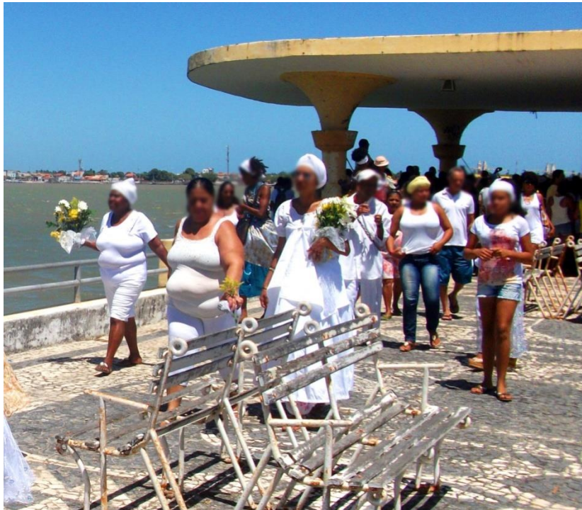
Figura 6 – Devotos com oferendas para Oxum

O ato de jogar flores no rio representou de forma simbólica uma aproximação espiritual maior com Oxum que se fazia presente através do Rio Sergipe, além de se mostrar como uma forma de homenagear, agradecer e respeitar a mãe das águas. Na figura 6, podemos observar os devotos e suas oferendas na ponte do imperador.