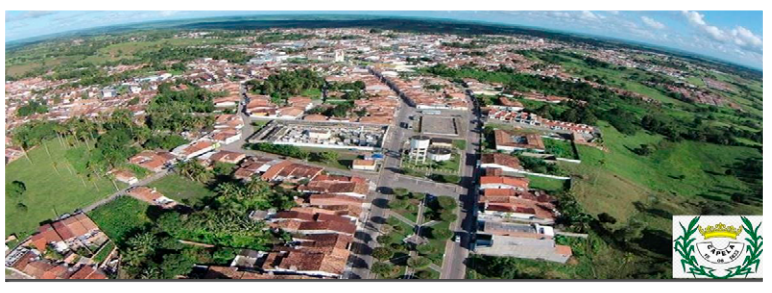
Imagem 6. Vista aérea da cidade de Capela