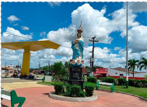
Estátua de Nossa Senhora da Purificação, padroeira do município de Capela, localizada na Praça Odília Fausto do Sacramento. Fotografia do autor (outubro/2020).