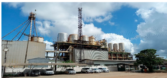
Fotografia do autor (abril/2021).