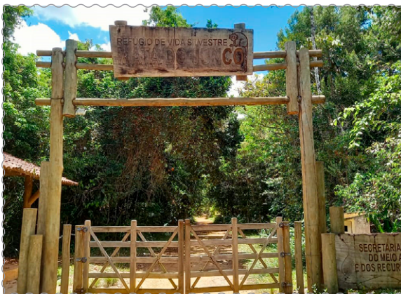
Entrada principal do RVS Mata do Junco. Fotografia do autor (novembro/2020).