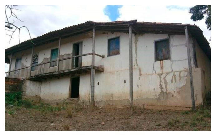
Fotografia de Aleksandro do Nascimento Macedo (abril/2016).

Em 1859, Capela possuía mais de 100 engenhos. Para a instalação de um engenho, eram necessárias, entre outras coisas, uma grande área de cana plantada, equipamentos para realizar o processamento e mão de obra, portanto somente pessoas “bem-sucedidas” economicamente eram capazes de tocar esse tipo de empreendimento.