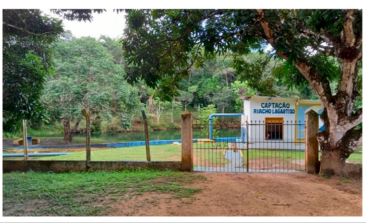
Fotografia do autor (abril/2021).

O rio Lagartixo é um afluente da margem direita do rio Japarutuba. Este nasce na Serra da Boa Vista, na divisa entre os municípios sergipanos de Graccho Cardoso e Feira Nova, e percorre cerca de 82 quilô-