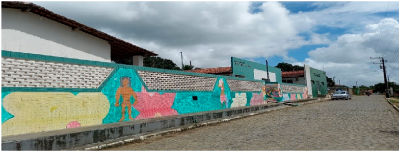
Fotografia do autor (maio/2021).

No município de Capela, estão localizadas três comunidades quilombolas reconhecidas pela Fundação Cultural Palmares: Pirangi, Cantagalo e Terra Dura e Coqueiral.