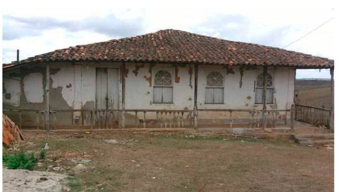
Fotografia de Alexsandro do Nascimento Macedo (abril/2016).