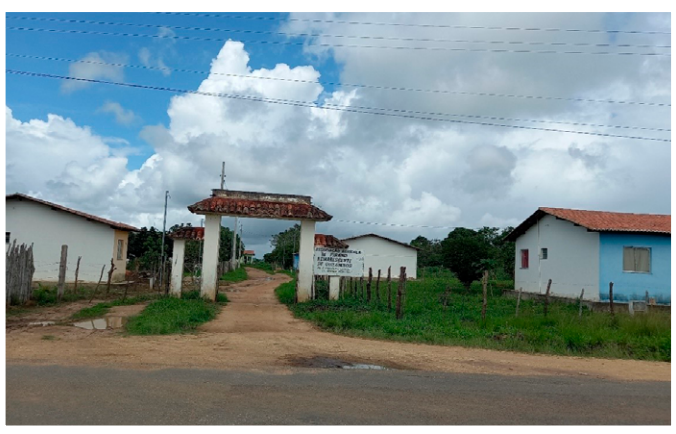
Fotografia do autor (maio/2021).

Na Comunidade Quilombola Pirangi, homens, mulheres e crianças trabalham juntos no cultivo da terra e plantam principalmente feijão, banana, cana-de-açúcar e mandioca.