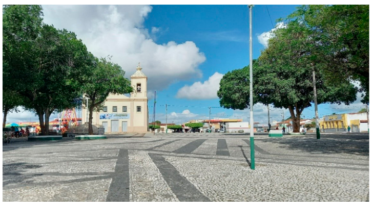
Fotografia do autor (abril/2021).