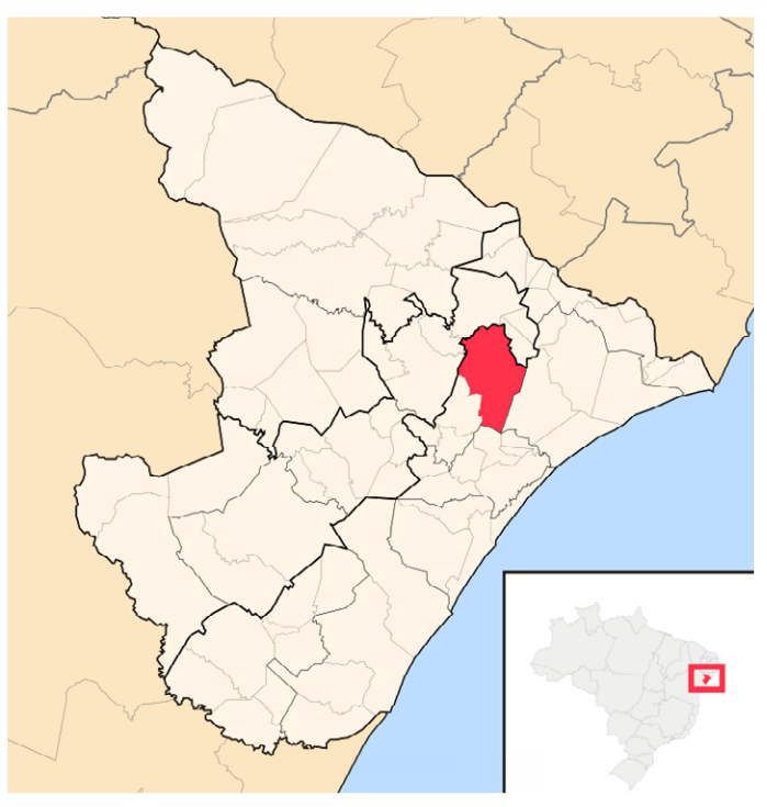
Imagem 4. Mapa de Sergipe destacando o município de Capela