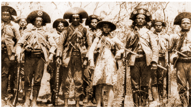
Imagem 22. Lampião e seu bando