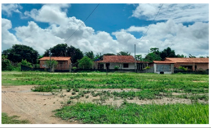
Fotografia do autor (maio/2021).

A Fazenda Santa Clara era uma propriedade com 4.250 hectares que cultivava cana para a fabricação de açúcar e paralisou as atividades em 1991. Em 1993, a fazenda foi a leilão por causa das dívidas, mas o preço mínimo estabelecido não foi alcançado. Nesse mesmo ano, a prefeita de Capela, Aurelina de Melo Sobral, solicitou, junto ao governo do estado, a aquisição da fazenda com o intuito de promover o assentamento de trabalhadores rurais.