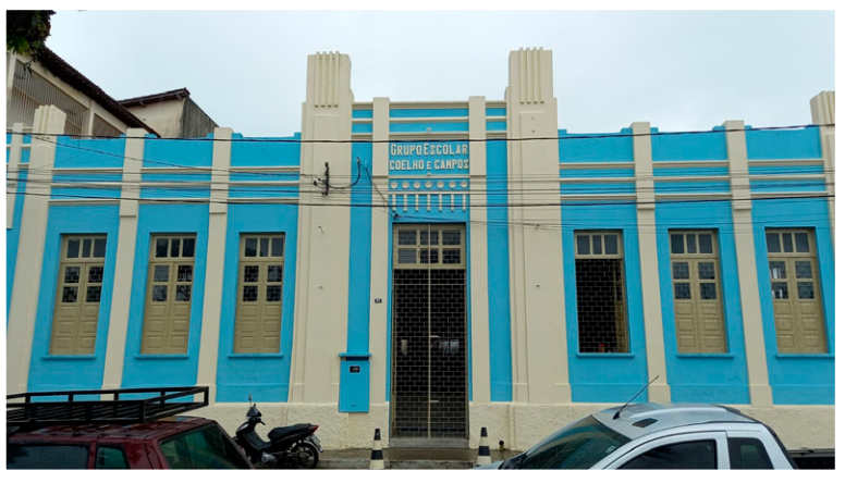
Fotografia do autor (julho/2021).