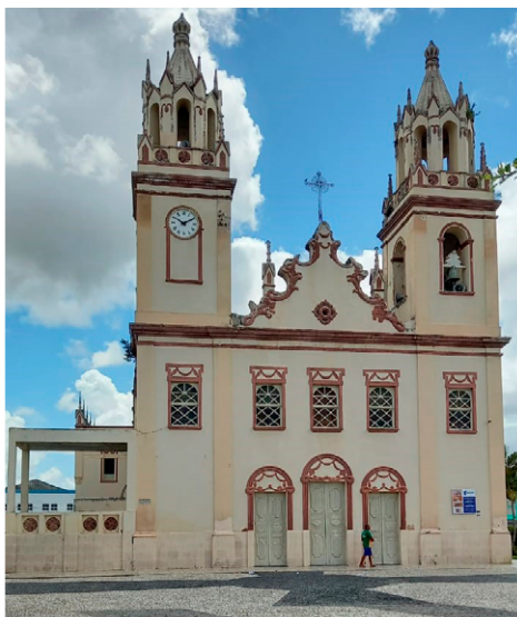
Imagem 5. Igreja Matriz de Nossa Senhora da Purificação*