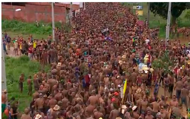
Imagem 12. Festa do Mastro de Capela

Fonte: Festa do Mastro de Capela encerra ciclo junino em Sergipe | São João 2018 | G1 (globo.com) . Acesso em: 22 jun. 2021.