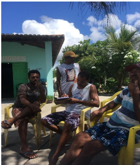
Figura 4: Aplicação do Questionário Semiestruturado