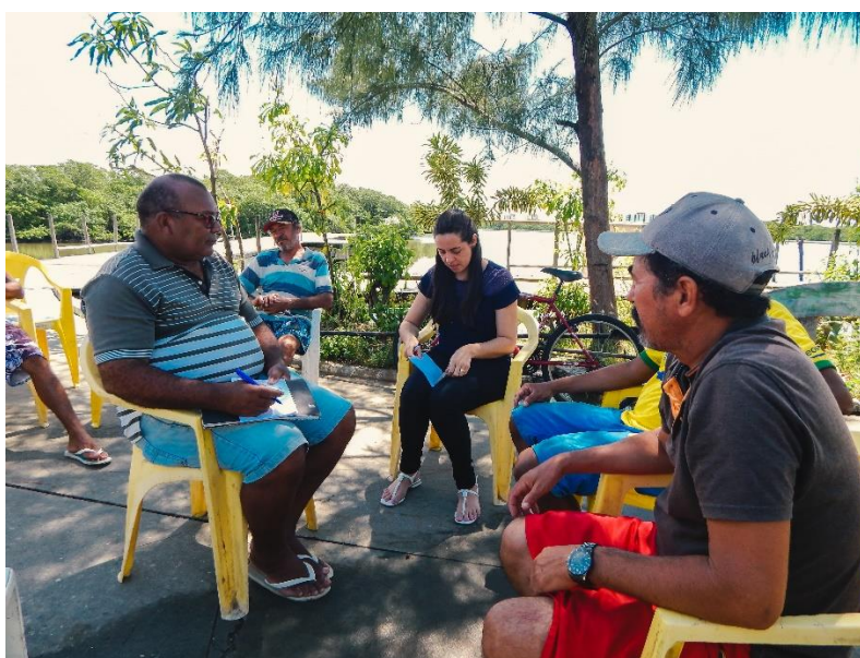
Figura 3: Roda de Conversa

Durante os assuntos abordados na roda (Figura 3), obtivemos registros de vídeos e fotografias deste momento, iniciando assim o protagonismo dos sujeitos. Observou-se que inicialmente houve sentimentos de timidez por parte dos sujeitos, mas não demorou muito e eles começam a se soltar mais diante da câmera. É importante ressaltar que os sujeitos reforçam o pedido de publicação dos vídeos, pois os mesmos estavam desejosos de se verem na gravação.