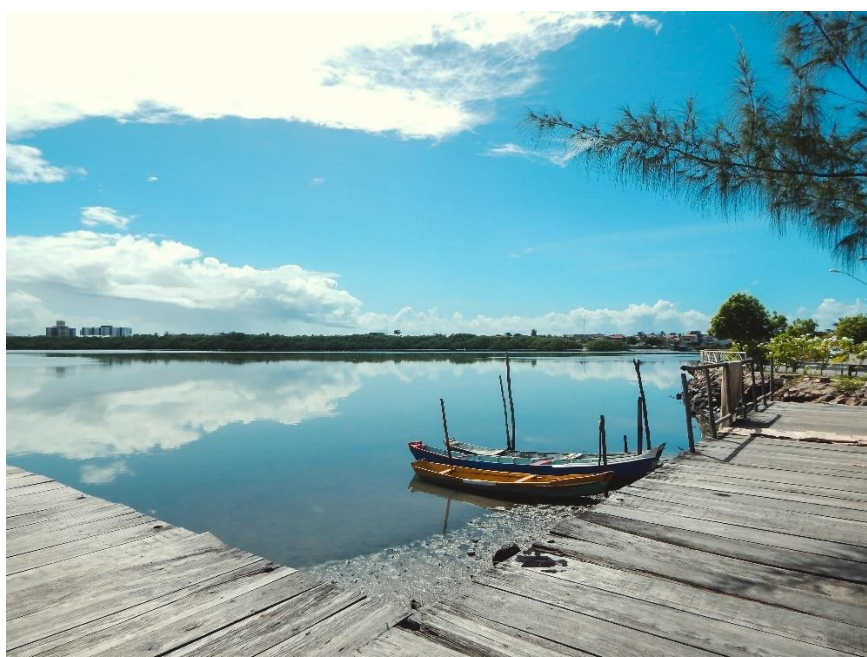
Figura 2: Píer localizado as margens da Associação