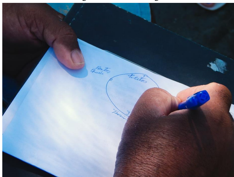
Figura 5: Arco de Maguerez G1

Após expressar de maneira clara o conteúdo abordado, entendeu-se que essa parte da metodologia seria como um reforço de preparação do caminho para que os sujeitos pudessem identificar as problemáticas socioambientais e como solucioná-las. Dando assim, partida para a execução do arco de Maguerez (Figuras 5 e 6).