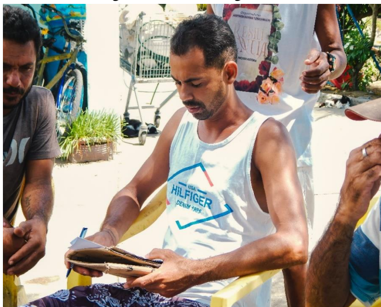
Figura 6: Arco de Maguerez G2