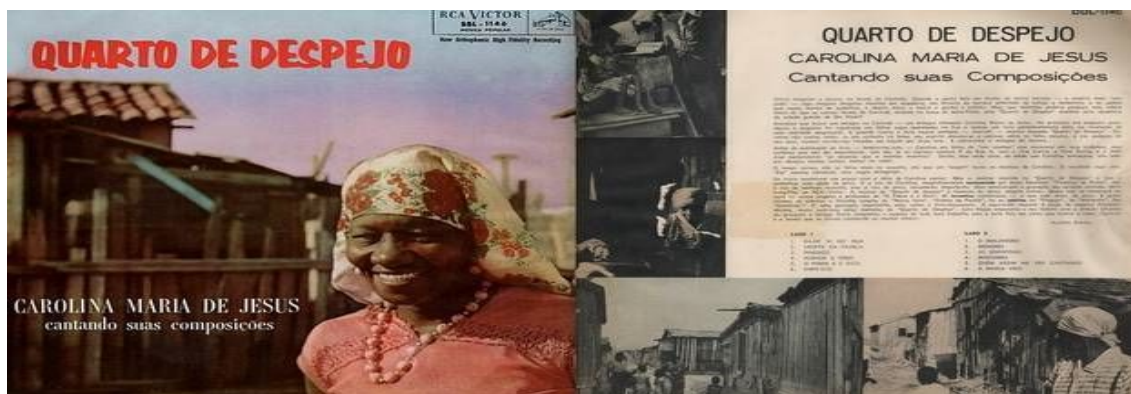
Figura 3: O livro Quarto de despejo