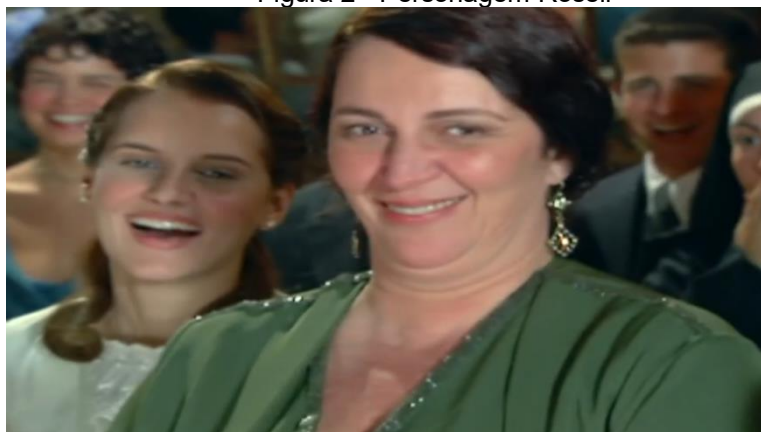
Figura 2 - Personagem Roseli

Embora o secretariado não fosse formalizado nem houvesse direitos trabalhistas na época retratada, a personagem Roseli desempenha funções típicas da profissão moderna e enfrenta situações que ainda são relatadas atualmente. Isso reflete a percepção de que essas funções são culturalmente associadas às mulheres. O secretariado se desenvolveu historicamente como uma profissão predominantemente feminina, e essa associação persiste na forma como as secretárias são representadas na ficção. Ao criar Roseli, o autor provavelmente se baseou nessa associação cultural, reforçando a visão tradicional de que o papel de secretária executiva é feminino. Na figura 2, observa-se a personagem Roseli.