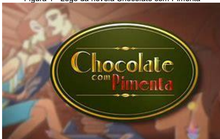
Figura 1 - Logo da novela Chocolate com Pimenta

O enredo da novela "Chocolate com Pimenta" e informações adicionais, com foco na personagem Roseli, foram obtidos por meio de observação direta dos episódios e consultas ao site Memorial Globo. A novela, uma produção da Rede Globo exibida entre 2003 e 2004, foi escrita por Walcyr Carrasco e ambientada na década de 1920, na fictícia cidade de Ventura, conhecida por sua tradicional fábrica de chocolates. Embora não seja especificado em qual estado brasileiro Ventura se localiza, a ambientação evoca uma próspera cidade do interior, sustentada em grande parte pela Fábrica de Chocolates Bombom, que tem um papel central na economia e na vida social da região. Na figura 1, apresenta-se a logo da novela.