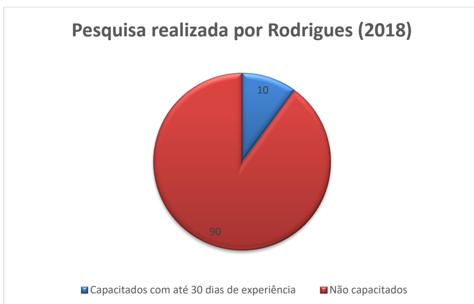
Gráfico 3 – Pesquisa realizada por Rodrigues

Fonte: Artigo de Rodrigues “Música e saúde: Uma visão bilateral sobre os benefícios interacionais” (2018, p. 6).