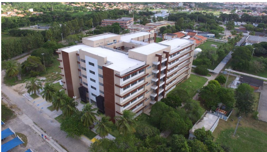
Figura 4: Didática VII, UFS, Campus São Cristóvão.

Abaixo uma imagem da Didática VII, no Campus São Cristóvão, onde está localizado o Departamento de música da UFS (DMU):