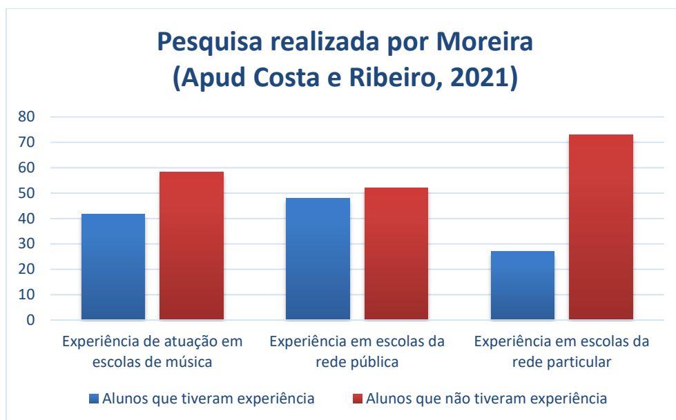
Gráfico 2 – Pesquisa/Costa e Ribeiro

Fonte: Artigo de Costa e Ribeiro “Estudos com egressos de Licenciatura em Música: o que revelam as publicações brasileiras” (2019, p. 17).