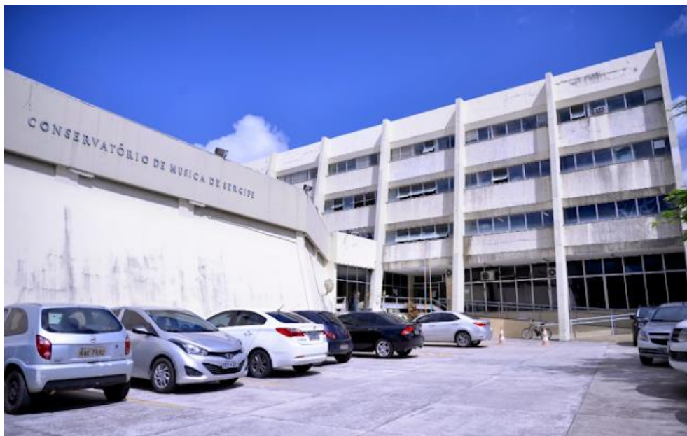
Figura 5: Conservatório de Música de Sergipe.