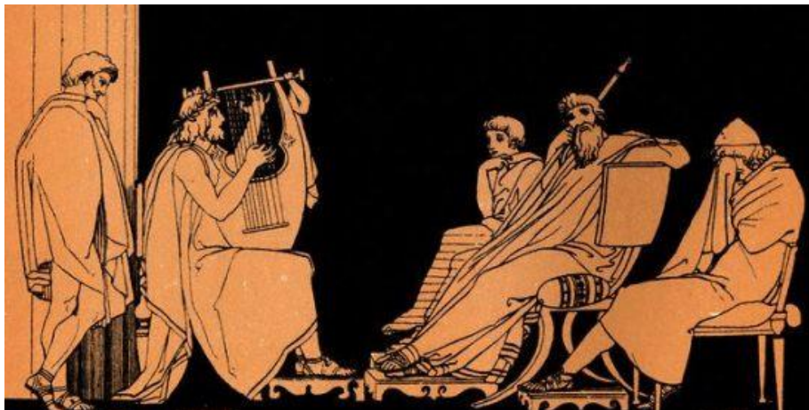
Figura 3: Arte grega – Representação da música