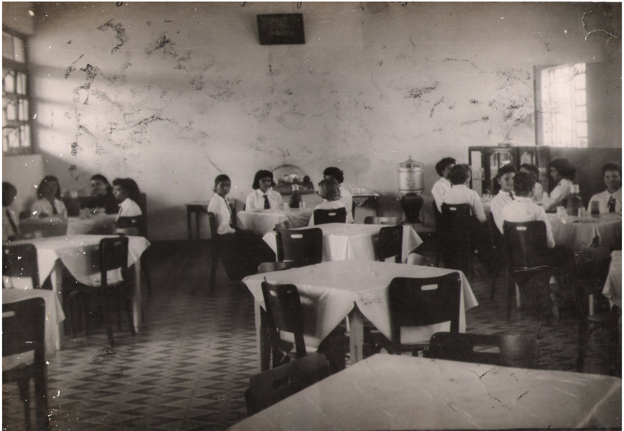
FOTO 20: Refeitório do Colégio Nossa Senhora das Graças.

implantação do Curso Técnico em Contabilidade na escola, no ano de 1954, instalaram também a sala de datilografia, a de mecanografia e o escritório modelo, todas equipadas para o pleno funcionamento de suas atividades. A escola também podia contar com uma sala destinada à inspetoria, uma tesouraria e uma secretaria.