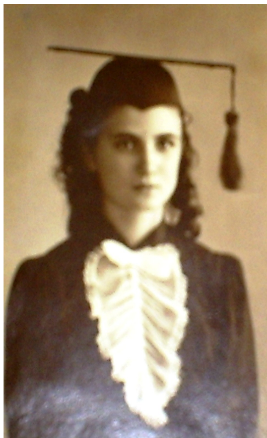
FOTO 28: Aluna com beca de formatura. 1948.

As festas de formatura eram, também, eventos de grande repercussão social. As solenidades, que contavam com atividades religiosas e festivas, eram prestigiadas por diversas autoridades. O Bispo Diocesano, o Governador do Estado, o Diretor do Departamento de Educação e o Prefeito da Cidade de Propriá eram convidados de honra. A primeira turma de normalistas foi formada na escola no ano de 1937.