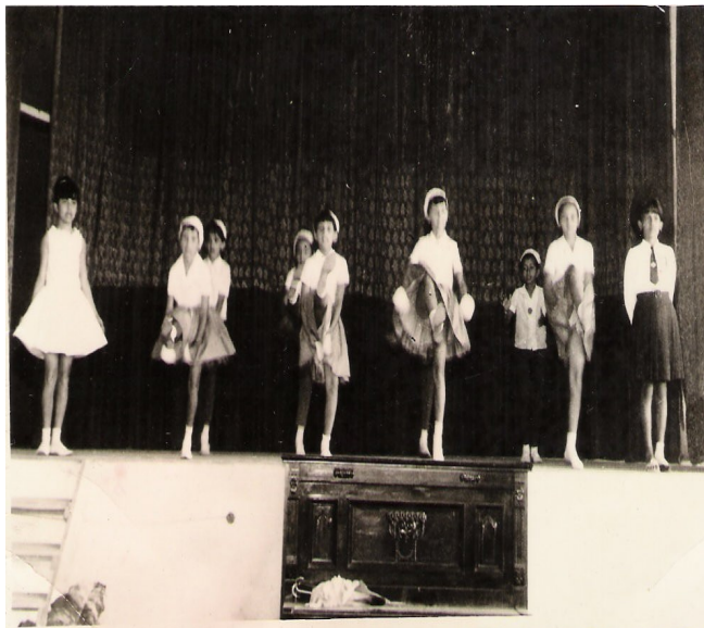
FOTO 21: Apresentações Artísticas. 1938.

As solenidades aconteciam em um auditório amplo, bem arejado e com boa iluminação.