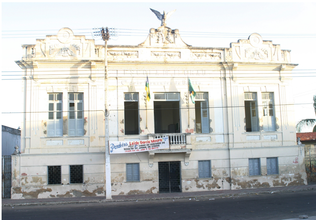
FOTO 07: Fachada atual do Colégio Estadual João Fernandes de Britto. 2006. FONTE: Acervo Particular da Autora. AUTORIA: Júlio César Santos.

custo das obras dos grupos era devido à sua monumentalidade. 40 Para tanto, foi proposto que se criassem os grupos escolares, mas, não extinguissem as escolas isoladas, que continuavam funcionando na maioria das localidades sergipanas, especialmente na zona rural e na maioria dos municípios do Estado de Sergipe. Contudo, estes grupos escolares se estabeleceram, no início do século XX, com arquiteturas imponentes, embelezando as cidades e retirando dos cofres públicos numerosas quantias de dinheiro para a edificação destas escolas.