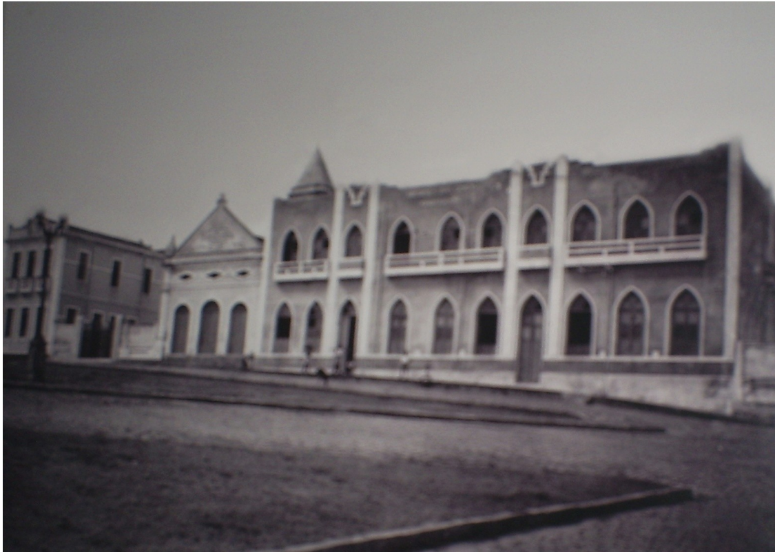
FOTO 11: Fachada do Colégio Nossa Senhora das Graças. 1954.

de suas filhas e estava pronto para oferecer uma educação que desse continuidade àquela recebida em casa, com disciplina e conforto e que se equiparasse àquela oferecida na escola da capital.