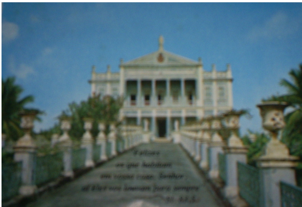
FOTO 14: Sede da CONFHIC 2006.

Segundo o Estatuto apresentado, a Congregação das Irmãs Franciscanas Hospitaleiras da Imaculada Conceição – Província de Santa Cruz, é uma sociedade de direito privado, sem fins lucrativos, filantrópica, e tem como finalidade criar, congregar, dirigir e manter instituições que visem a beneficência, a promoção humana, a educação, a cultura, a evangelização, o ensino e a assistência. Possui registro no Cartório do Registro Civil das Pessoas Jurídicas em Salvador – BA, no Livro A-2, às Folhas 48 – 50, sob o número de ordem 2.042 de 1º de dezembro de 1967, também no Conselho Nacional do Serviço Social (CNSS) do MEC, desde 1968, pelo processo nº 202.296 / 68, no Cadastro Geral dos Contribuintes (CGC) da Secretaria da Receita Federal (SRF) do Ministério da Fazenda (MF), sob o número 15.233.646 / 0001 – 94 e na Secretaria de Finanças da Prefeitura de Salvador sob o número 000634 / 001 – 21.