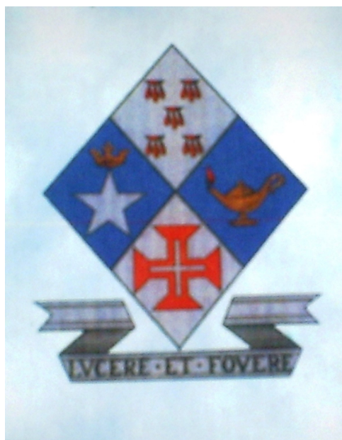
FOTO 15: Brasão da CONFHIC. 80 2006.

No dia 10 de setembro de 1911, quatro irmãs da Congregação seguiram para Monte Alegre, em Belém do Pará, onde fundaram o Colégio São Francisco. Em 12 de setembro do mesmo ano, mais seis irmãs partiram para instalar o Colégio Santo Antônio, agora em Alencar, também no Pará. No mesmo ano de 1911, outras irmãs da Congregação Hospitaleira da Imaculada Conceição seguem para Itacoatiara, no Amazonas, para, a pedido de Dom Frederico Brício de Souza, fundar o Colégio Pio X. E, assim seguiram as irmãs educadoras, instalando-se em diversas partes do Brasil, disseminando seus dogmas por muitos Estados.