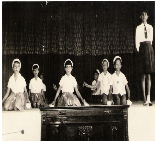
FOTO 22: Apresentações Artísticas. 1938.