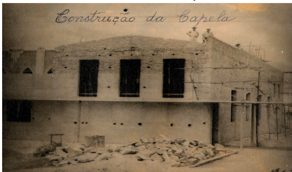
FOTO 24: Construção da Capela de Nossa Senhora das Graças. 1950.

A capela do Colégio Nossa Senhora das Graças foi construída em anexo ao prédio principal e, no decorrer do tempo, foi restaurada e modernizada para bem atender, tanto a comunidade escolar como a sociedade no geral. A Capela de Nossa Senhora das Graças se transformou em um templo de grandes comemorações religiosas de Propriá, onde a elite celebra seus casamentos, aniversários e missas festivas importantes na comunidade.