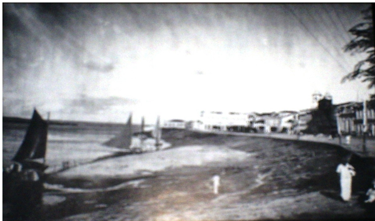
FOTO 02: Vista de Propriá na década de 1940.

Em 21 de fevereiro de 1866, através da Resolução Provincial nº 755, Propriá foi elevada à categoria de cidade.