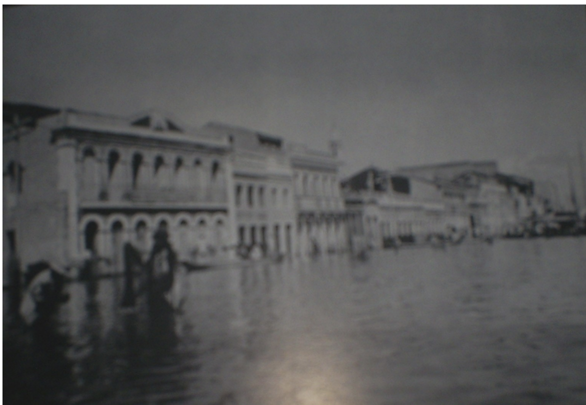
FOTO 06: Enchente do Rio São Francisco em Propriá. 1979.

Semanas decorriam e a cidade preparava-se, a atividade econômica migrava para a área mais elevada, as casas ribeirinhas eram abandonadas e as pessoas abrigavam-se na parte alta da cidade. Não se deve afirmar que as enchentes não traziam nenhum prejuízo econômico à cidade, mas os danos físicos e econômico não eram a face mais marcante. 34