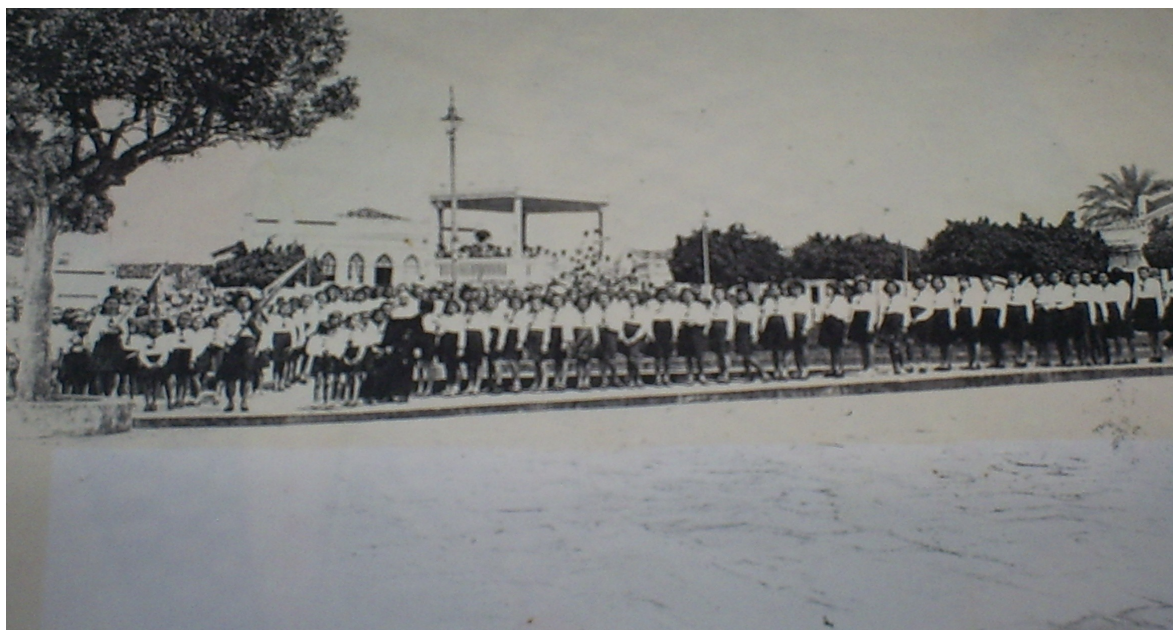
FOTO 25: Desfile Cívico. 1960.

Os desfiles cívicos aconteciam em datas comemorativas como a Independência do Brasil, no sete de setembro; no dia da árvore, que também era comemorado com muita relevância e no aniversário da instituição. No sete de setembro, as alunas empolgadas exibiam seu fardamento de gala e os pais orgulhosos lotavam as praças e avenidas para aplaudir suas filhas, pois, como já foi destacado anteriormente, era motivo de muito orgulho para as famílias ribeirinhas ter uma filha estudando no Colégio Nossa Senhora das Graças 101 . Na ocasião das comemorações cívicas eram grandes os cuidados, principalmente com os uniformes que deveriam estar impecáveis. As saias plissadas deveriam estar todas rigorosamente na mesma altura, as blusas extremamente brancas e engomadas. As irmãs verificavam tudo de perto porque o Colégio prezava sempre pela organização.