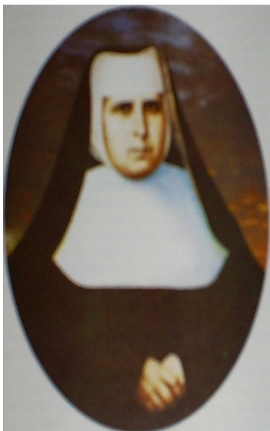
FOTO 12: Madre Mª Clara do Menino Jesus FONTE: Acervo particular de Rejane Valente AUTORIA: Desconhecida