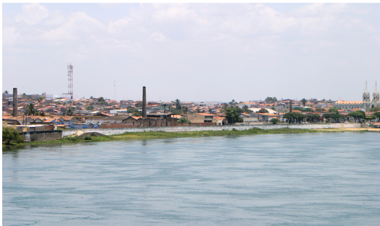
FOTO 05: Vista Panorâmica da Cidade de Propriá e do Rio São Francisco. 2006. FONTE: Acervo Particular da Autora. AUTORIA: Júlio César Santos.

Através da Lei Imperial nº 1015 de 04 de outubro de 1928, o atual município de Cedro de São João se torna independente de Propriá, e fazendo parte de seu território o município de São Francisco de Assis. Novamente, Propriá perde território e área de comando direto em função do desenvolvimento rural e de sua própria região. Mas, continua sem perder a sua importância como centro regional e continua em ascensão. 28