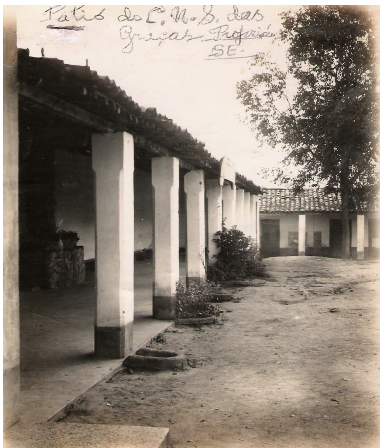
FOTO 23: Pátio do Colégio Nossa Senhora das Graças.

O Colégio Nossa Senhora das Graças possuía uma biblioteca com capacidade para dez leitores ao mesmo tempo, cerca de 1.247 volumes distribuídos em compêndios, dicionários, livros didáticos, científicos e literários. Possuía, ainda, duas mesas medindo 1,72 metros de comprimento por 0,80 metros de largura cada uma, dez cadeiras e três armários com prateleiras.