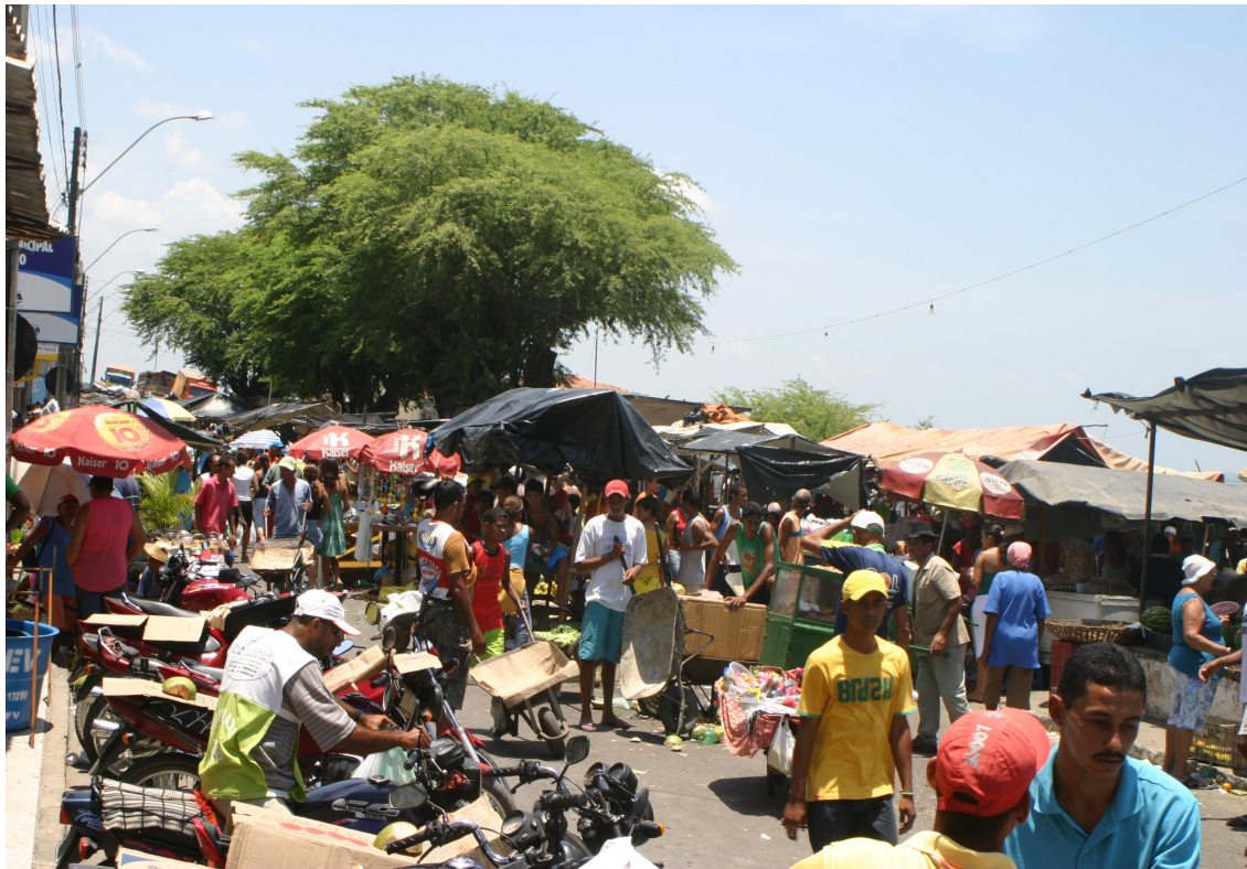
FOTO 04: Feira Livre de própria no Centro Comercial da Cidade. 2006.

Inúmeros acontecimentos importantes ocorreram com a implantação da Indústria Têxtil de Propriá. Um exemplo disso são as inúmeras construções habitacionais que foram erguidas nas imediações da referida empresa, bem como variadas casas comerciais que foram inauguradas para atender esta crescente população que se formava. É possível afirmar que muitas famílias de agricultores abandonaram suas atividades, migraram para Propriá em busca de emprego na Empresa de Fiação e Tecelagem Propriá e, alguns deles, eram pessoas com pouca instrução educacional, já que a indústria têxtil de Propriá acolhia, desde trabalhadores, homens e mulheres chefes de família, e, inclusive, menores de idade, os quais abandonavam os bancos escolares para contribuir no sustento da família. 26