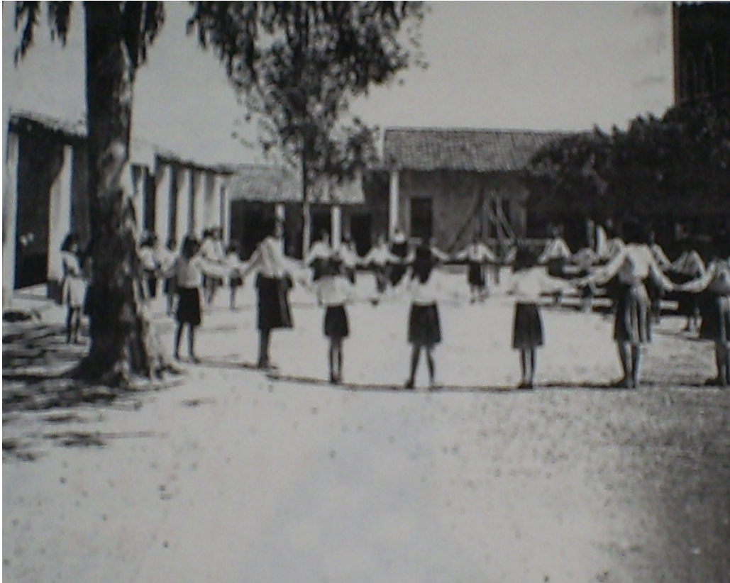
FOTO 17: Pátio do Colégio Nossa Senhora das Graças.

Os passeios também eram muito apreciados pelas internas. Eles aconteciam sempre na companhia de alguma religiosa, seja para o cinema, na seção vespertina ou, para o espetáculo de circo. Quando existiam, a oportunidade era aproveitada pelas alunas com muito entusiasmo.