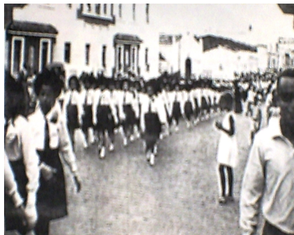
FOTO 27: Desfile cívico. 1960.

Outro evento da maior importância para o Colégio era o aniversário do mesmo. Esse momento, de muita alegria para as irmãs e as alunas, era compartilhado com as famílias e a comunidade em geral. Também, outras comunidades escolares, principalmente aquelas que eram dirigidas pela mesma congregação, participavam. Eram alunas vindas dos colégios de Aracaju, Estância, Penedo, Arapiraca, além de representação de Salvador, sede da Congregação.