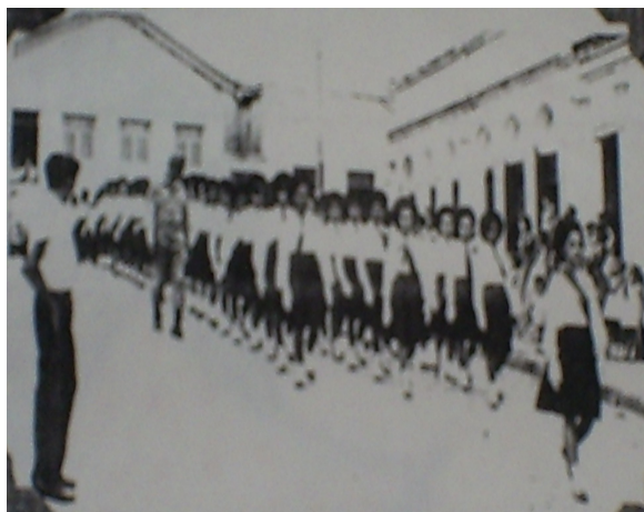
FOTO 26: Desfile cívico. 1960.