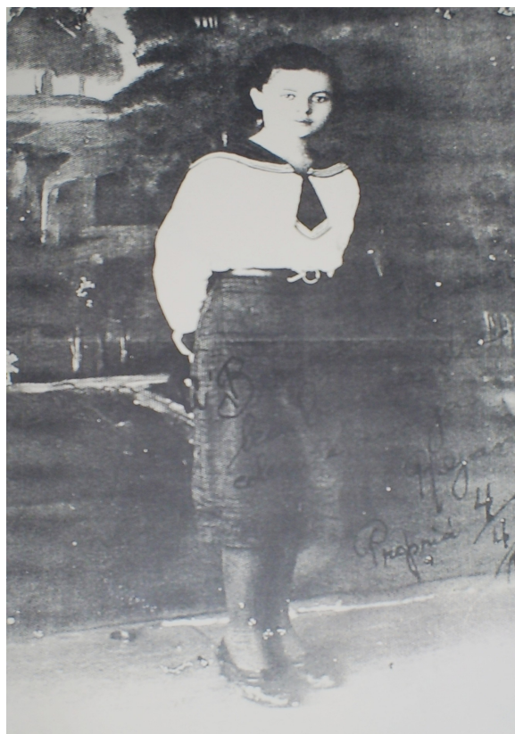
FOTO 18: Farda de gala do Colégio Nossa Senhora das Graças. 1944.

O fardamento era fiscalizado diariamente e era composto de saia plissada, com tamanho definido sempre abaixo do joelho, camisa branca com mangas, gravata azul com o escudo da escola gravado, sapatos pretos e meias brancas. Tudo deveria estar sempre muito limpo e extremamente engomados. Esse cuidado com a higiene era, também, rigorosamente controlado pelas irmãs, não se admitiam meias sujas, blusas amassadas e amareladas e saias sem o maior rigor na forma. Os cabelos muito bem lavados e penteados e as unhas sempre cortadas também eram exigências fundamentais que deveriam ser obedecidas pelas alunas.