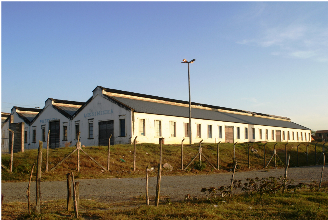
FOTO 03: Empresa de Fiação e Tecelagem Propriá. 2006. FONTE: Acervo particular da Autora. AUTORIA: Júlio César Santos

Segundo relatos, as feiras livres eram mais movimentadas e duradouras e as casas comerciais renovavam seus estoques freqüentemente. Isso porque o fluxo de vendas ocorria à vista, devido às boas condições de vida da população, fruto do grande desenvolvimento econômico vivido pela cidade ribeirinha de Propriá e pelos municípios vizinhos.