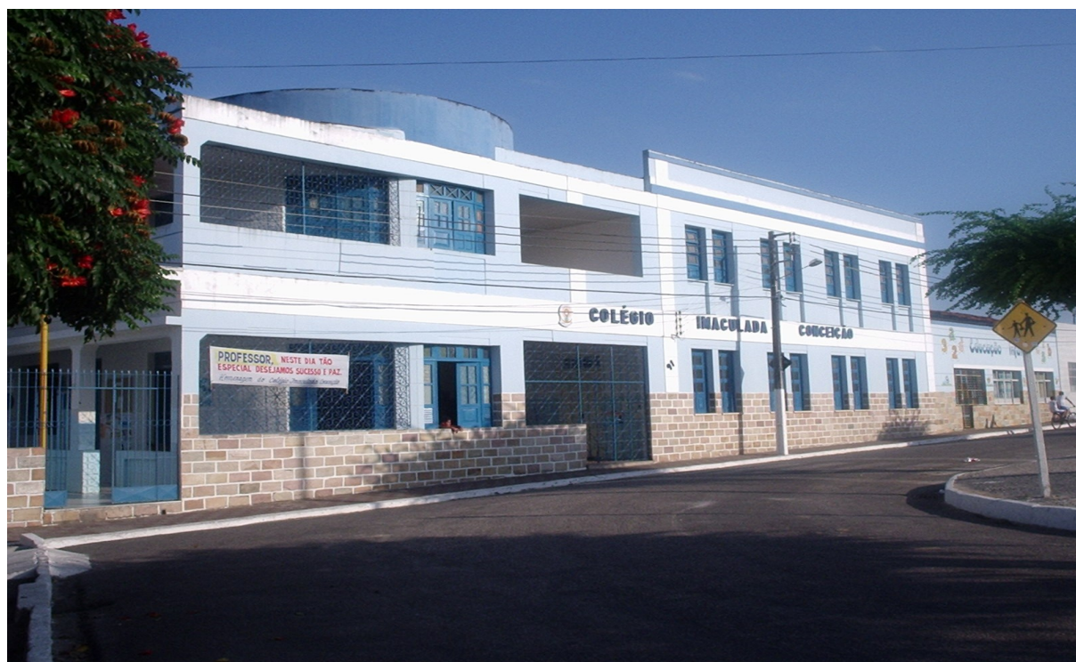
FOTO 09: Fachada do Colégio Imaculada Conceição em Capela/SE.2006. FONTE: Acervo particular da autora. AUTORIA: Elizabeth Santos.

Todas as escolas citadas são instituições de ensino edificadas em ambientes que representam verdadeiros “palácios do saber”. A estrutura exuberante chamava a atenção e despertava o desejo de pais e alunas.