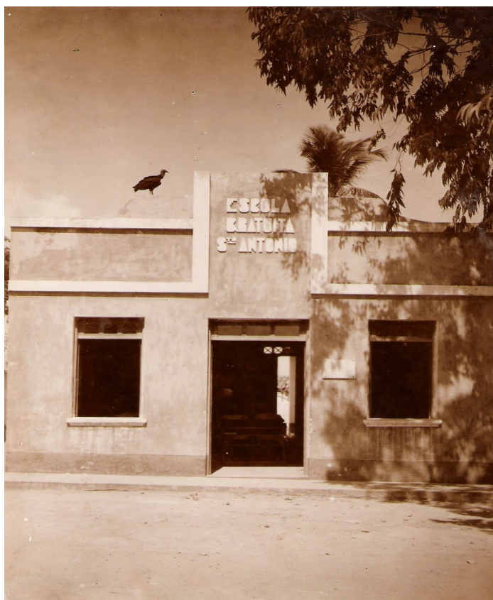
FOTO 16: Fachada da Escola Gratuita de Santos Antônio. FONTE: Acervo do Colégio Nossa Senhora das Graças. AUTORIA: Desconhecida

A escola gratuita para meninas não dispunha de tamanha suntuosidade, mas, representava uma oportunidade para aquelas que gostariam de estudar e não dispunham de recursos financeiros para pagar.