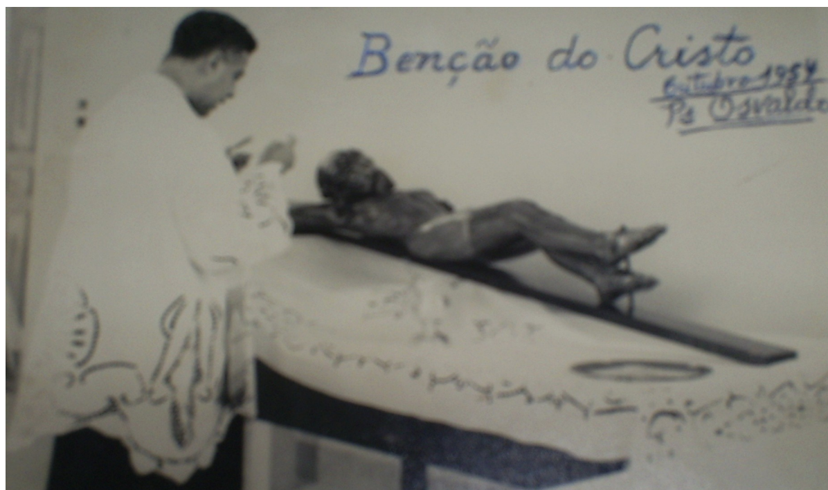
FOTO 29: Bênção do Cristo da capela do Colégio Nossa Senhora das Graças. 1954.

A capela era o espaço reservado para os muitos eventos religiosos, como a primeira eucaristia, as missas em ação de graças e as missas rotineiras do domingo. O dia da bênção do Cristo da capela foi um acontecimento muito importante e mereceu destacada atenção da sociedade local, da imprensa e de diversas autoridades eclesiásticas, políticas e econômicas.