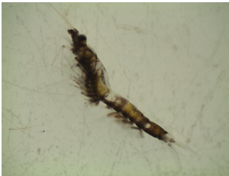
Figura 1. Exemplo de um macho de Mysidopsis juniae .

dias) para serem utilizados nos testes, e renovação total uma vez por mês juntamente com pareamento dos organismos (3 ♀ : 1 ♂). Diariamente os animais foram alimentados ad libitum com náuplios de Artemia sp. (48h) enriquecidos com óleo de fígado de bacalhau e o óleo de peixe. O cultivo foi mantido em sala climatizada ( 24 \pm 2^{\circ}\text{C} ) com fotoperíodo de 12 h luz : 12 h escuro e aeração constante (Figura 2).