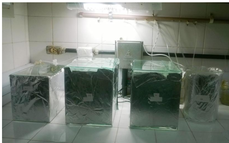
Figura 2: Aquário do cultivo dos misidáceos Mysidopsis juniae .