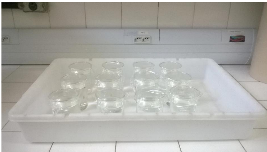
Figura 3: Exposição ao tolueno para avaliação da toxicidade aguda em Mysidopsis juniae

Ensaios de toxicidade com Mysidopsis juniae seguiram a norma NBR 15.308 (ABNT, 2011) sobre testes de toxicidade aguda de 96 h. Organismos de 1 a 8 dias de vida foram expostos às concentrações de tolueno, em béqueres de vidro com volume final de 250 mL, com triplicata, sendo adicionados a cada béquer 10 indivíduos (Figura 3).