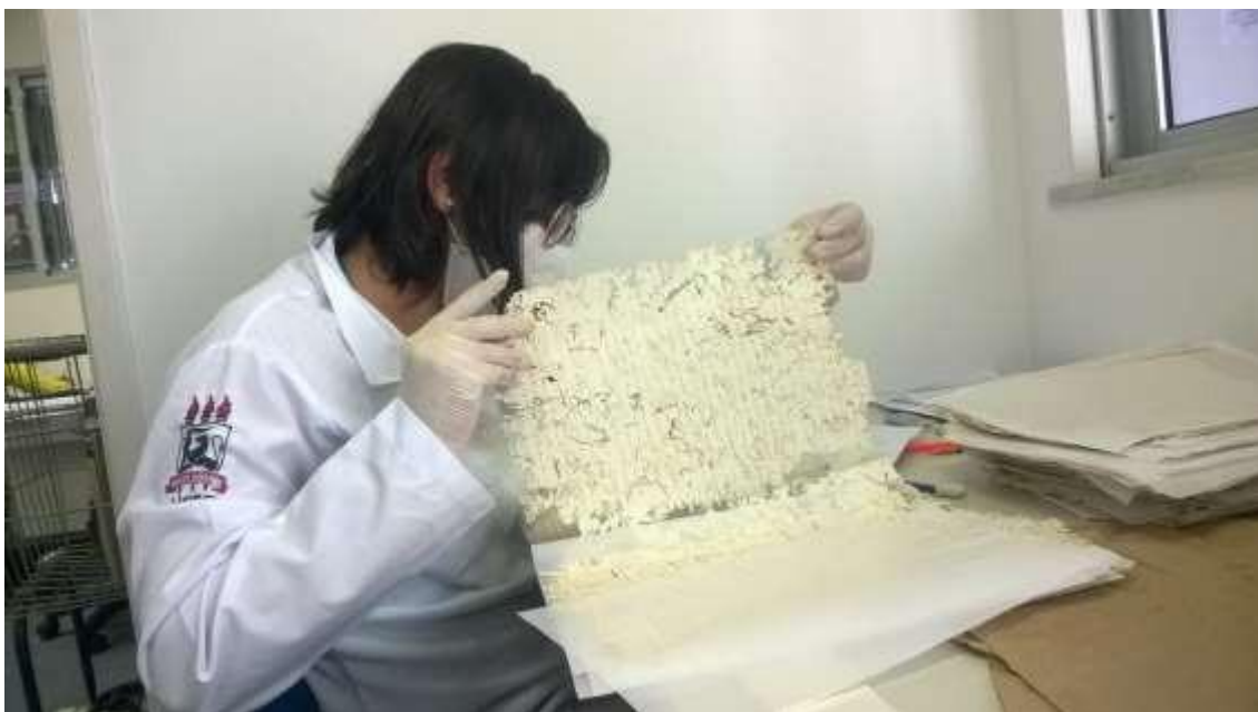
Figura 2: Trabalho de leitura das fontes e coleta de dados realizado pela bolsista de IC.