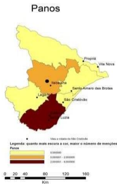
Mapa 3: distribuição e concentração regional dos panos.