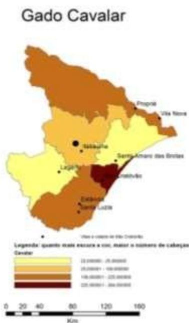
Mapa 8: Distribuição e concentração regional do gado cavalos.

Devido aos pequenos números encontrados para os porcinos e caprinos, não foram confeccionados mapas que mostrassem sua distribuição e concentração regional como os até aqui apresentados. Mas uma última questão a ser considerada é a participação