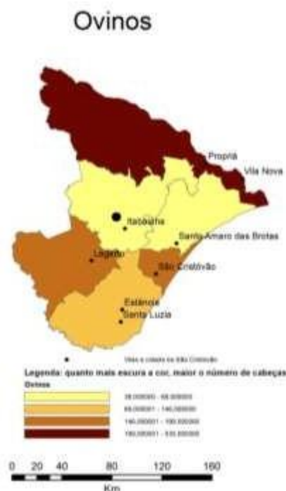
Mapa 7: Distribuição e concentração regional dos ovinos.

As mulas, usadas basicamente para percorrer longas distâncias, no transporte de pessoas e mercadorias, são encontradas em grande