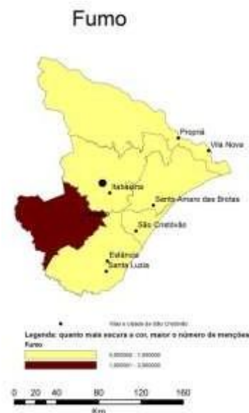
Mapa 4: distribuição e concentração regional do fumo.

Em Sergipe, as autoridades metropolitanas, que vinham tomando uma série de medidas econômicas buscando o desenvolvimento português, enviavam à Câmara de São Cristóvão, em 1779, uma ordem para dar início à cultura do algodão na capitania (NUNES, 2006, p. 165). No entanto, pós 1820, o algodão brasileiro