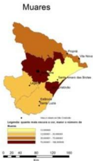
Mapa 9: Distribuição e concentração regional dos muares.

de Porto da Folha e Vila Nova na pecuária sergipana: apesar de possuir a maior concentração apenas do rebanho bovino, caprino e ovino, essa região do Rio São Francisco criava em quantidades significativas todas as espécies. Ocupavam segundo lugar no caso dos muares e também na de cavalos.