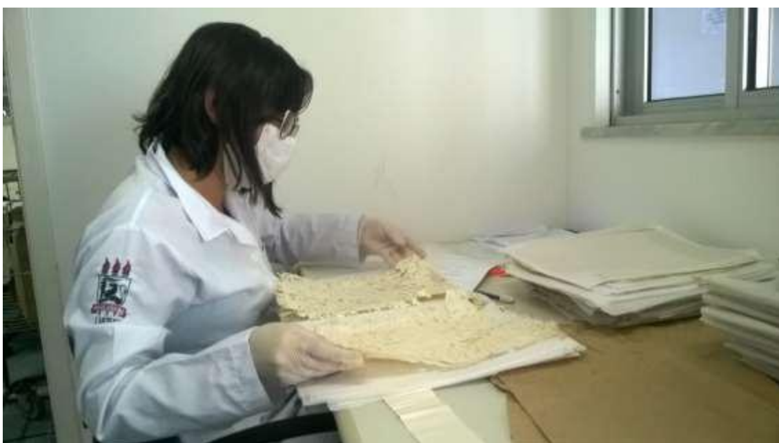
Figura 3: Estado da documentação.

Os procedimentos de coleta e análise das informações dos inventários seguiram os postulados da chamada História Quantitativa ou Serial: a produção de um banco de dados cobrindo determinada série temporal, as duas primeiras décadas do século XIX, e o uso de técnicas estatísticas para trata-los e tabulá-los, nesse caso o programa Statistical Package for the Social Sciences (SPSS). Foram confeccionadas tabelas com a distribuição da riqueza inventariada por decís (Tabela 1), com a composição dos patrimônios inventariados segundo as categorias de bens (Tabela 2), com a repartição