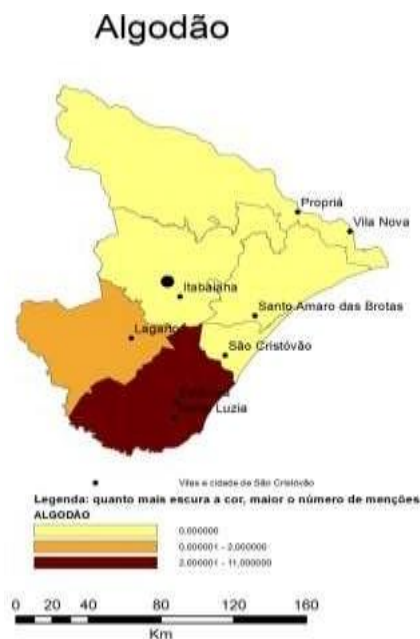
Mapa 2: distribuição e concentração geográfica do algodão.

Mapa 2 , e seu processamento, Mapa 3 . A lavoura algodoeira era basicamente uma cultura de exportação. Os inventos no setor têxtil que marcaram o início da Revolução Industrial na Europa, em meados do século XVIII, valorizam o algodão enquanto matéria-prima, crescendo em grande escala sua demanda. Planta pouco exigente e de