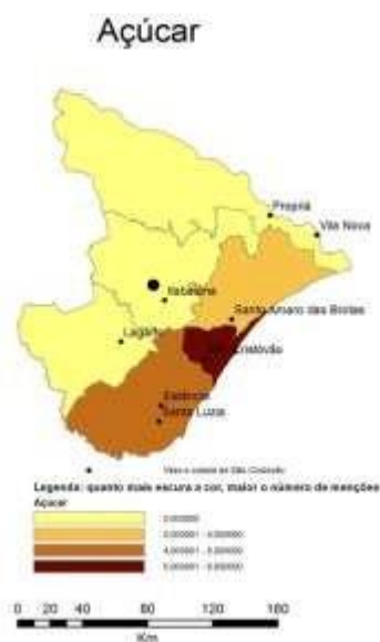
Mapa 5: distribuição e concentração regional do açúcar. na segunda metade do século XVIII (NUNES, 2006, 149).

O fumo, Mapa 4 , outra cultura de exportação, apresentava-se pouco comum em quase todas as regiões da capitania, exceto Lagarto. Segundo Thetis Nunes, a lavoura fumageira havia sido a principal de Sergipe,