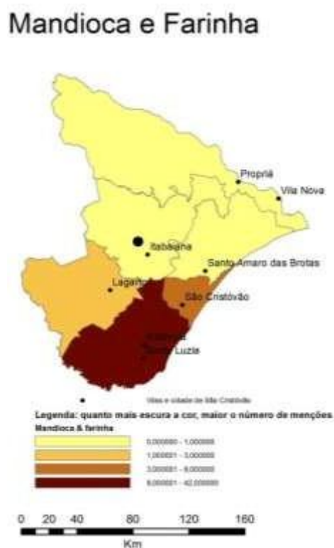
Mapa 1: distribuição e concentração regional da mandioca e farinha de mandioca.

A lavoura mais presente nos inventário sergipanos é a mandioca ou farinha de mandioca. Inúmeros documentos fazem menção a “capoeiras de mandioca”, “rodas de ralar mandioca”, ou arolavam alguns alqueires de farinha. O Mapa 1 mostra que a região de Estância e Santa Luzia era a maior produtora da capitania, seguida de São Cristóvão e Lagarto, mas também deixa claro que ela estava presente em todo o Sergipe Del Rei, ainda que em pequenas quantidades.