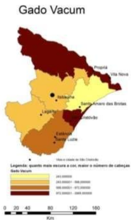
Mapa 6: Distribuição e concentração regional dos bovinos.

Assim como a mandioca e a farinha, no caso dos produtos agrícolas, o gado bovino estava disseminado por toda