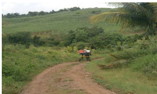
Figura 7 – Foto de uma charrete de cavalo.

Do ponto de vista de atividades de lazer, é possível o passeio de charrete (existe uma no local), de cavalo, trilhas a pé, de bicicleta, pesque pague, além da visita em todas as áreas de produção da mesma. (figura 7).