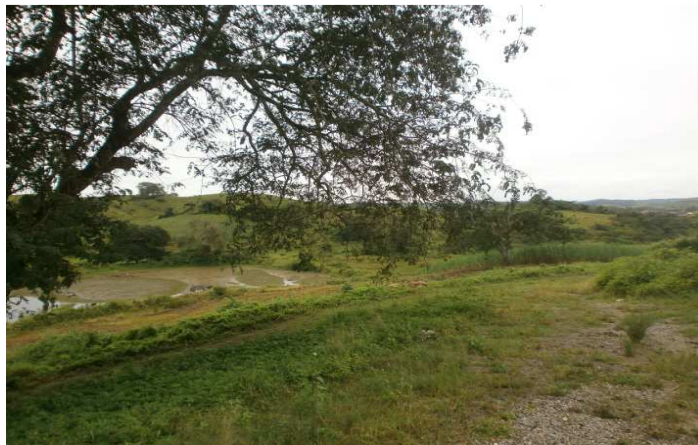
Figura 2 – Foto da Fazenda Lyra.

A fazenda é da época dos engenhos e tem como principais características uma casa grande, com quatro quartos (com forro), sendo um com banheiro interno; grande, aonde é possível alocar 10 pessoas; Uma cozinha com antessala, uma lateral com cadeiras já preparadas para receber um número bom de pessoas; uma mobiliária antiga, assim como sua estrutura rústica. Existe um riacho chamado Sangradouro da bacia de Japaratuba, a 50m da sede.