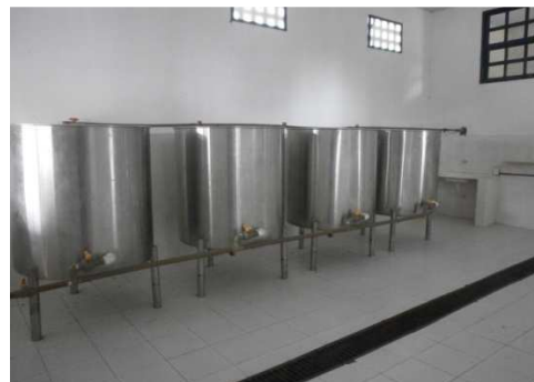
Figuras 3 e 4 – Produção com intuito da comercialização junto à Usina.

Além da produção de cachaça, carro chefe da fazenda, a mesma tem produção de mel, com uma casa de mel, Apiário com produção de ovos de galinha de capoeira, piscicultura, com 2 mil tilápias, pecuária de corte e está sendo preparada uma estrutura para a criação de pecuária de leite, com o intuito do aproveitamento do mesmo para o feitiço de doce do queijo e o uso do leite como insumo para a culinária rural. Há ainda a suinocultura e o espaço para matriz de cunicultura, o que agregam valor a produção local. Desenvolve como atividade secundária: A minhocultura e a avicultura colonial ou capoeira.