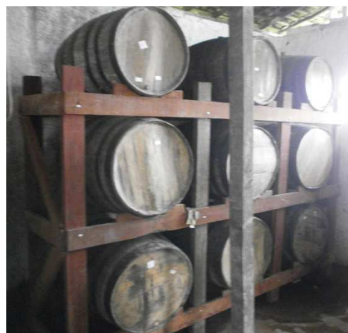
Figuras 5 e 6 – Alambique tradicional e Barris de Pinho.

São quatro áreas ao entorno da sede da fazenda voltada para a produção da cachaça. O restante da