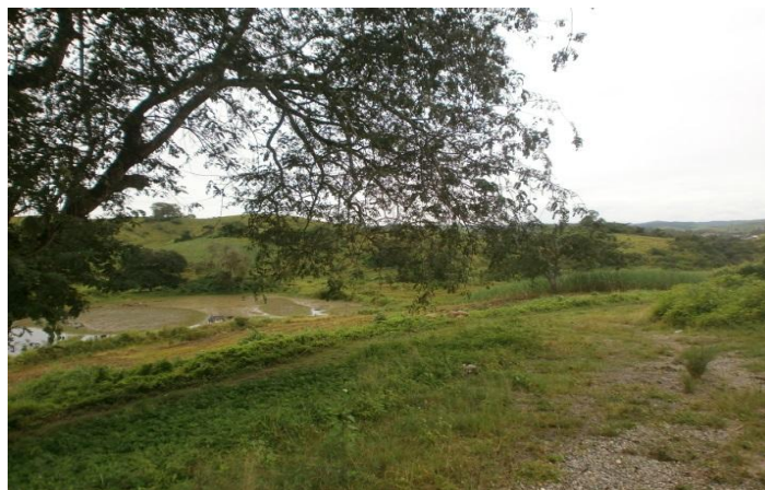
Figura 2 – Foto da Fazenda Lyra.

A propriedade tem uma área de 247 ha e apresenta uma área de reserva legal permanente de 51,44 ha. Sendo essa área de Mata Atlântica e vegetação de transição (umbaúba, jenipapeiros, jurema etc..).