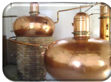
Cachaçaria Reserva do Barão 6