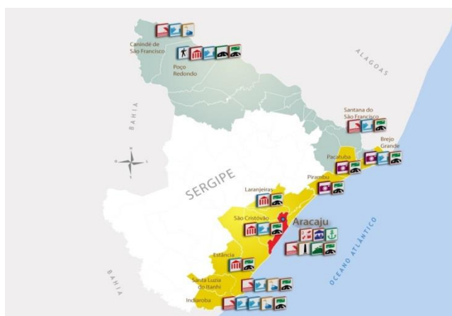
FIGURA 05: ESPACIALIZAÇÃO DOS INVETIMENTOS DO PRODETUR

Outra importante referência da organização do turismo na região do litoral sul sergipano é o Programa de Desenvolvimento do Turismo [PRODETUR], de acordo com a Unidade de Coordenação de Projetos [UCP] do PRODETUR, nos últimos dez anos foram investidos na região cerca de R$ 40 milhões em intervenções e investimentos públicos que vão desde a recuperação de rodovias até a instalação de atracadouros de usos de pesca e turismo. Isso deve ser associado aos investimentos do Ministério do Turismo nos últimos cinco anos com cerca de R$ 350 milhões, notadamente pelos investimentos das pontes Jornalista Joel Silveira sobre o Rio Vaza Barris, ligando a Capital Aracaju a Itaporanga D'Ájuda e, a Ponte Gilberto Amado sobre o Rio Piauí, ligando Estância a Indiaroba, servindo para reduzir o acesso entre as capitais de Sergipe e Bahia em cerca de 50 km viabilizando a chamada linha verde mais próxima da costa marítima, tendo como resultado para o turismo o aumento do fluxo de pessoas. Sergipe (2012)