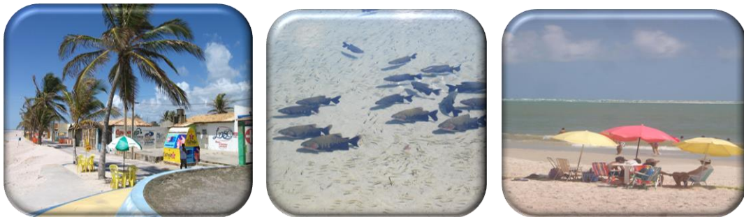
FIGURA 3: PRAIA DO ABAÍ, LAGOA DOS TAMBAQUIS E PRAIA DO SACO – ESTÂNCIA, 2011.

também incentiva a produção associada ao turismo como pesca e artesanato por meio de vários projetos. Ao município de Indiaroba cabe a função de principal portão de entrada do fluxo rodoviário do litoral sul, notadamente turistas baianos, maior polo emissor de turistas para Sergipe. Silva (2013).