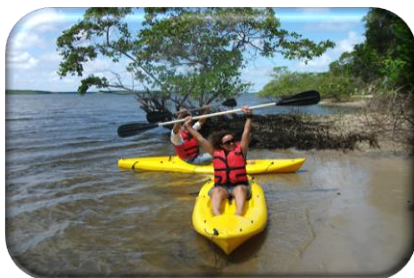
Rio Piauí -

Estes atrativos de Estância vinculados à oferta de sol e praia se inserem em roteiros que incluem o passeio nos Rio Piauí e Real, bem como a travessia para Mangue Seco. A evidência do apelo rural surge com atrativos do seu meio, com atividade de agricultura e pecuária, distribuídas em propriedades dos três municípios. Em terra caída foi identificada propriedade que oferece visitaç o de grupos escolares com finalidade educacional sobre o cultivo de manejo agr cola sustent vel e agricultura org nica. Em Est ncia e Santa Luzia do Itanhy, antigas casas de engenho foram recuperadas com objetivo inclusive de abrir para recepç o ao turista. Uma cachaçaria artesanal tamb m se apresenta aberta para visitaç o embora n o componha nenhum roteiro ofertado atualmente.