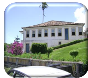
Engenho São Félix