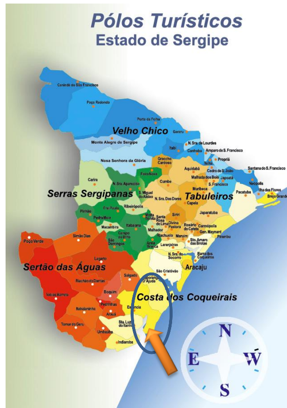
Figura I – Polos de Desenvolvimento Integrado do Turismo em Sergipe.

IX Congresso Internacional sobre Turismo Rural e Desenvolvimento Sustentável